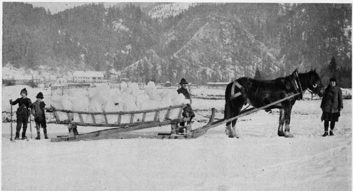
Ratečani prevažajo led z Ledin na bližnjo železniško postajo. Letna produkcija 300 vagonov prinaša revni gorski vasi vsaj nekaj zimskega zaslužka

Tudi na Hrvaškem, v Bosni in v Srbiji so nekatere ledenice vršile in še vrše isto nalogo, tako ledenice v Kapeli, »Ledenica« pri Trvnju nedaleč od Ključa v Bosni, »Ledenica« pod Rtanjem v Srbiji, ki dobavlja kristalno-čiste ledene klade Aleksinački banji, in še druge.