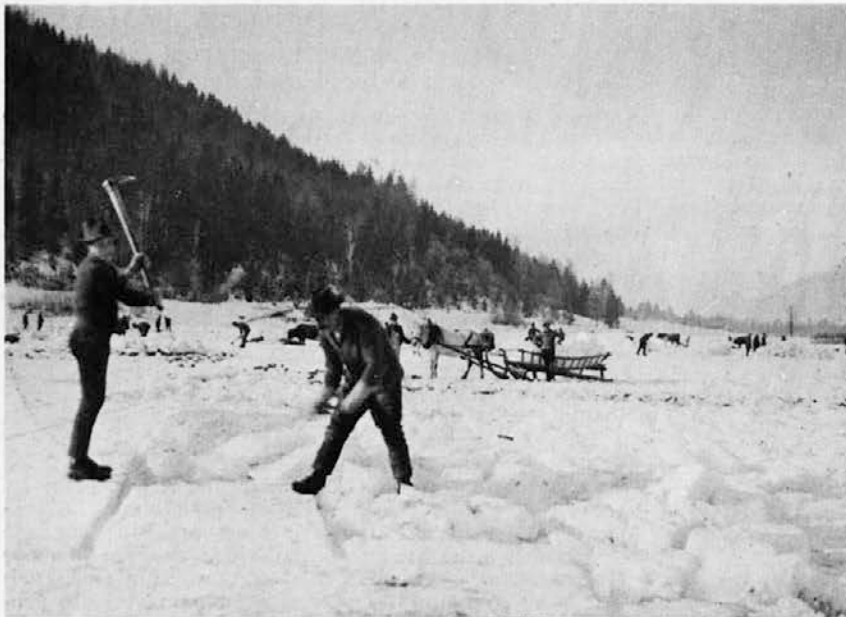
Ledine v Ratečah na Gorenjskem pozimi. Sekira in kramp sta orodje »ledarja«

bila do rapalskega miru vsaj deloma na ozemlju rateške občine. Tu so imeli ledu nekoč (krog l. 1896-97) toliko, da so nalomili celo skladovnico, jo zavarovali z deskami in beli tovor izvažali potem v maju in juniju. Pred vojno so plačevali trgovci za vagon ledu 8 do 9 goldinarjev, danes pa znaša njegova cena 450 Din za 10 tonski in 900 dinarjev za 20 tonski voz.