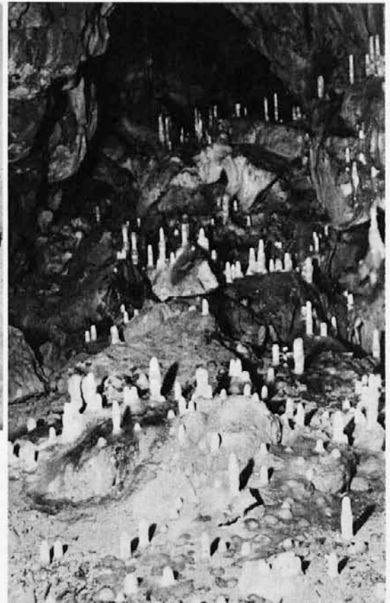
Desno: Ledenica pod Taborom, nedaleč od Županove jame. Svojčas so Kraševci prekrbovali primorska mesta z ledom iz takih ledenic

V bolj južnih krajih, kjer voda po zimi sploh ne zmrzuje, so bili in so deloma še danes navezani ali na uvoz ledu od drugod, ali ga pa dobivajo tu in tam iz naravnih »ledenice«, t. j. podzemeljskih jam, v katerih se tvori led. Takih jam imamo v apnenastem ozemlju zelo mnogo. Nahajajo se n. pr. tudi v Kamniških Alpah, na Veliki planini (V Kofcih, Mala veternica, Velika veternica), vendar pa te za gospodarsko izrabo ne pridejo v poštev. Toľiko važnejše so pa nekoč bile ledenice na Krasu. Iz Friedrichsteinske ledenice pri Kočevju led izvažajo menda še sedaj. Najbolj pa so kmetje svojčas izkoriščali slične jame na Nanosu in v Trnovskem gozdu. Na Nanosu nosita dve celo ime »ledenik« in sicer sta to Veliki in Mali Trški ledenik. Iz obeh so okoličani jemali led in ga vozili v Trst; zadnjič se je to zgo-