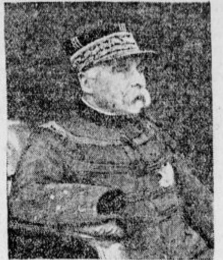
Francoski general Pau.