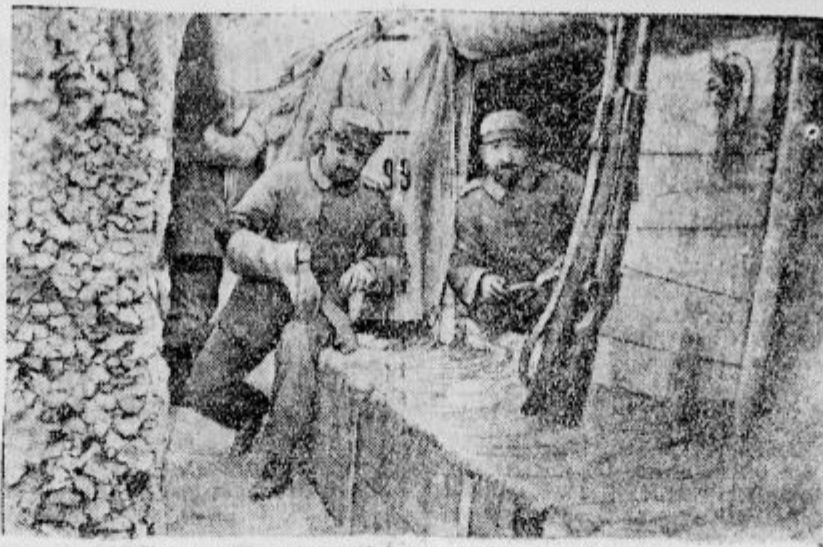
Iz nemškega strelskega jarka pri Reimsu.