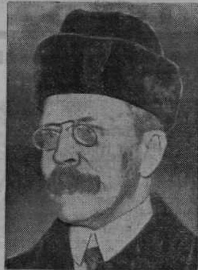
Cajander, minister Finske, katerega se upira ruskemu prokroviteljstvu