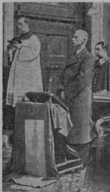
Novi predsednik Poljske Raczkiewicz prisega v pariški cerkvi ob prevzemu predsedniških poslov