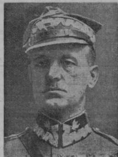
General Sikorski, predsednik poljske vlade v Parizu