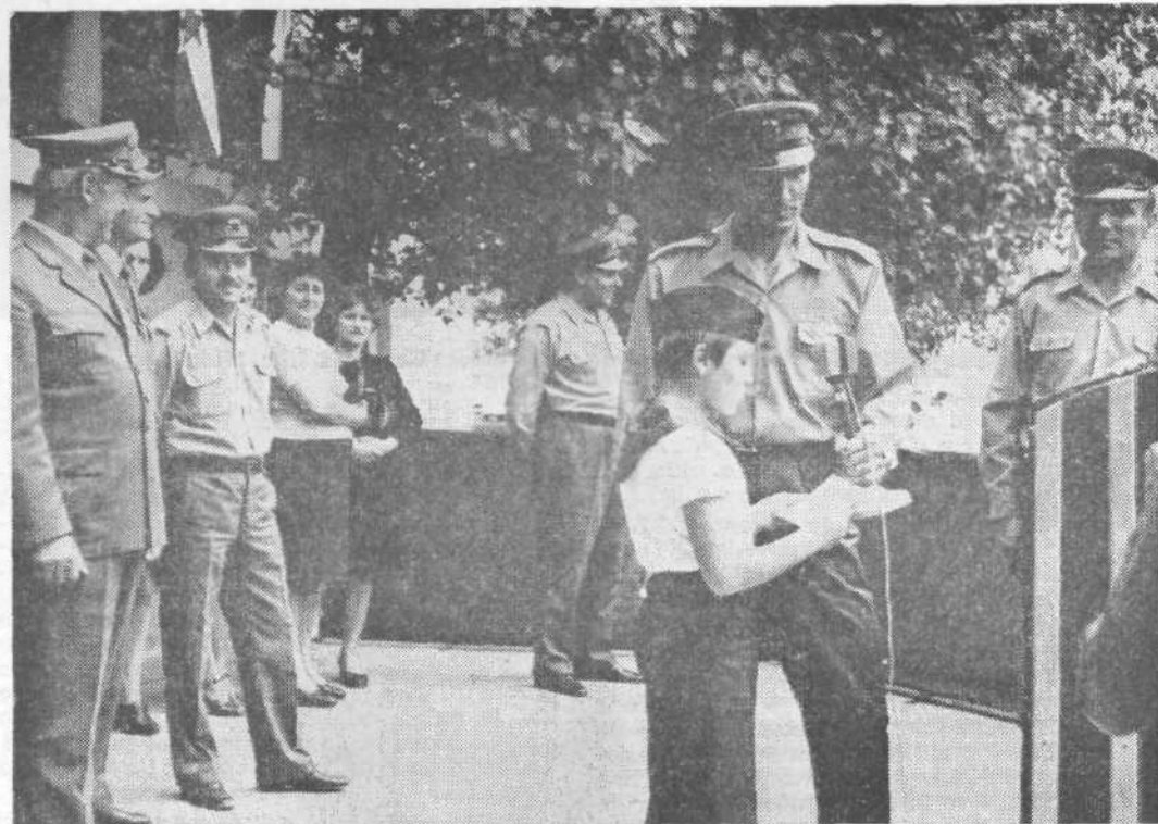
Mlade vojake je na svečani zaobljubi pozdravil tudi mladi pionir...

binske primere sodelovanja med tema pomembnima členoma naše družbe, ki sta že v svojem bistvu postavljena na skupni imenovalec. No, in če že brskamo za tovrstnimi temami, potem verjetno daleč naokrog ne bomo našli boljšega gradiva kot v vojašnici »Boris Kidrič« v Ljubljani.