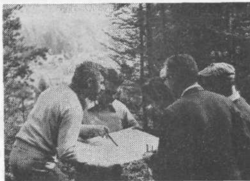
Pri reševanju taktične naloge

Na pohodu, ki je še najbolj pomemben, se je izkazalo za zelo dobrodošlo topografsko znanje, ravnanje z busolo in hoja po karti. V »neznanim svetu« se lahko kaj hitro izgubiš in prideš v »sovražnikovo zasedo«, pa čeprav v gostilno, ki se na srečo več ne programira na vsej trasi.