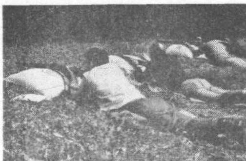
Na strelni črti

Topografsko znanje je bilo pri starejših oficirjih nadpovprečno. Najboljši so bili pešadijci, mornarji in vezisti, gotovo pa tisti, ki so nedolgo tega končali šolo za rezervne oficirje. Prav bi bilo, če bi obstajale nove karte z novimi topografskimi znaki. S temi kartami bi rezervni starešine lahko tudi sami vadili topografijo na vikendih in terenih, ki jih večkrat obiskujejo v prostem času. Dobro namreč vemo, da sta povsod na terenu urbanizacija in razvoj komunikacij zadnja leta marsikatero pokrajino popolnoma spremenila. Da bi bila stara karta še bolj nepregledna, imamo zgrajenih dosti novih poti in cest.