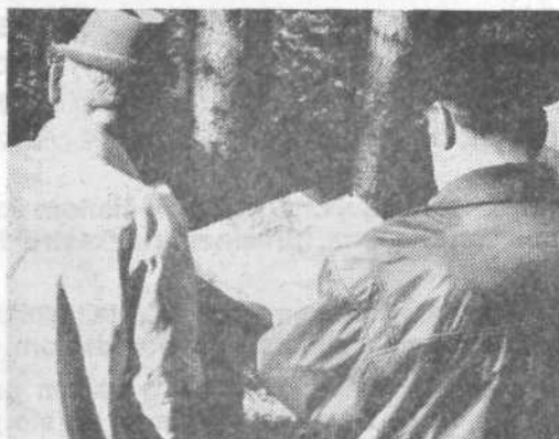
Pri reševanju topografske naloge

Uspeh v reševanju taktične naloge je bil v celoti relativno dober. Pri vseh starešinah se je poznalo, da so bili preveč sigurni v material, ki se je na seminarju posredoval. Ta »vodilni«, več let trajajoči sistem bo treba spremeniti, da bi bili rezervni starešine bolj samostojni pri rešitvah svojih nalog. Tudi povezava naloge »na pravi teren« bi imela več uspeha.