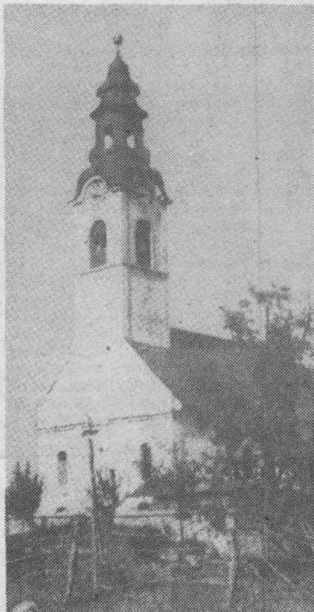
Urh – spomenik in živ spomin na številne žrtve je danes eden najbolj obiskanih spomenikov našega mesta.