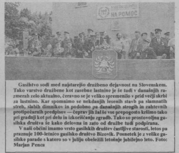
Gasilstvo sodi med najstarejšo družbeno dejavnost na Slovenskem. Tako varstvo družbene kot zasebne lastnine je še tudi v današnjih razmerah zelo aktualno, čeravno se je veliko spremenilo v prid večji skrbi za lastnino. Kar spominja se nekdanjih lesenih stavb pa slamanatih streh, slabih dimnikov in podobno pa današnjih strogih in zahtevnih protipožarnih predpisov — čeprav jih žal še vse prepoznajo kršimo tako pri gradnji kot pri delu in izkoriščanju zgradb. Tako so prostovoljna gasilska društva še kako delovna in zato od družbe tudi podpirana. V naši občini imamo vrsto gasilskih društev častljive starosti, letos pa praznuje 100-letnico gasilskega društva Bizovik. Posnetek je z velike gasilske parade s katero so v juliju obeležili letošnje jubilejno leto.

Omeniti velja, da je bila v prvi polovici leta predvsem uspešna prodaja papirja na domačem trgu, in to tako fizično kot vrednostno. 17.779 ton papirja so prodali na domačem trgu, precej več, kot so načrtovali. Poprečna prodajna cena doma je znašala 178,50 dinarjev za kilogram pa-