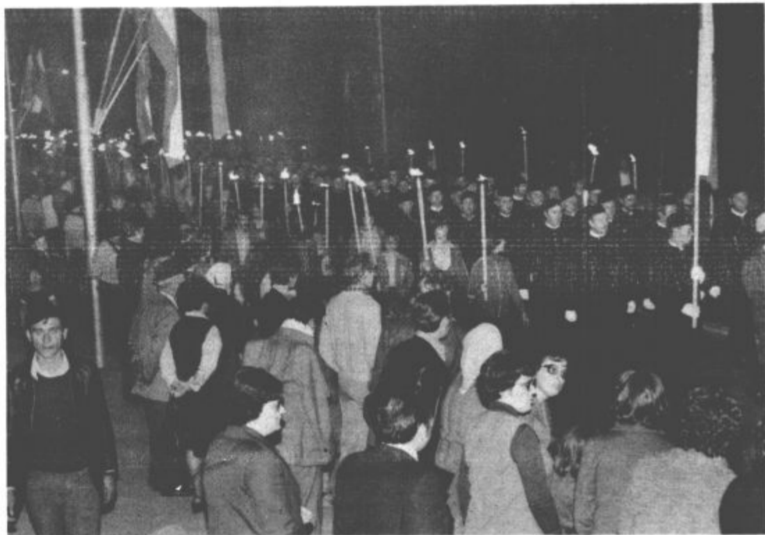
Velenjski sindikat je ob letošnjem delavskem prazniku organiziral že tretjo prvomajsko baklado