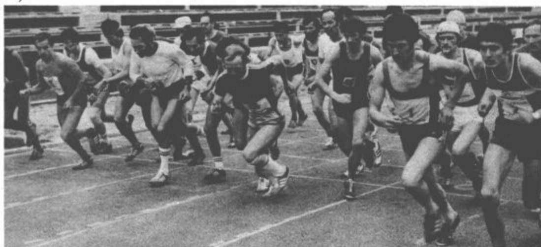
Start maratoncev na stadionu ob jezeru

Selekcija Velenje-Mozirje – Tasič (Šoštanj), L. Podgoršek, Podvratnik in F. Podgoršek (Smartno), J. Hudarin in R. Frangeš (Velenje), Benetek (Mozirje), Kolenc (Ljubno), R. Hudañ (Vel.), Prašnikar (Smartno), Kopašar (Ljubno), A. Omladič in Motoh (Smartno).