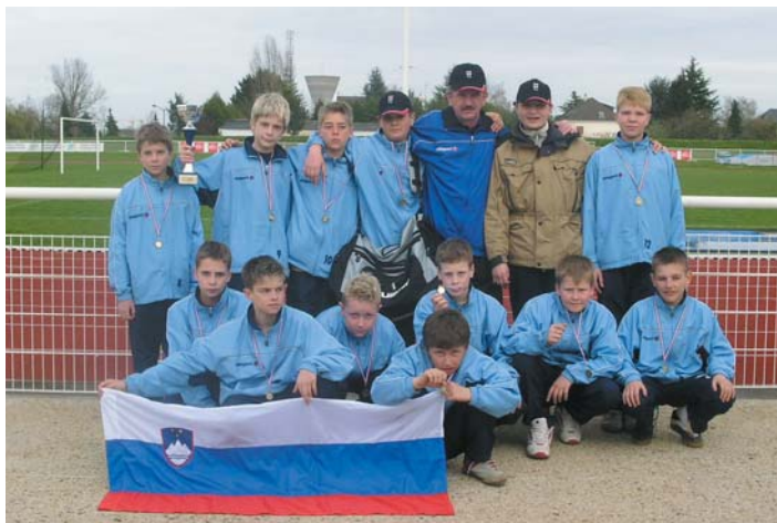
Mladi nogometaši s kolajnami, pokalom in slovensko zastavo