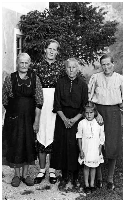
Izgnanci leta 1950.

Ljudje so se poznali veliko bolj kot danes, vsi mladi so se poznali med seboj. Moja mati je poznala vse ljudi v okoliških vaseh, tudi na nasprotnem bregu. Zato je še toliko manj razumljivo, zakaj so