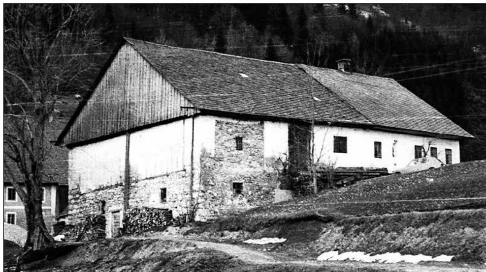
Torka, leta 1950.

liglot, njegovo poznavanje slovanskih in germanških jezikov, kulture je bilo neprecenljivo. Prevajal je iz nemščine in tudi iz gotice. Občudovanja vredna je bila njegova umirjenost in izjemna širina. Vedno se je želel pogovarjati tudi o šoli, zraven je sodila tudi kakšna zanimiva prigoda iz njegovega