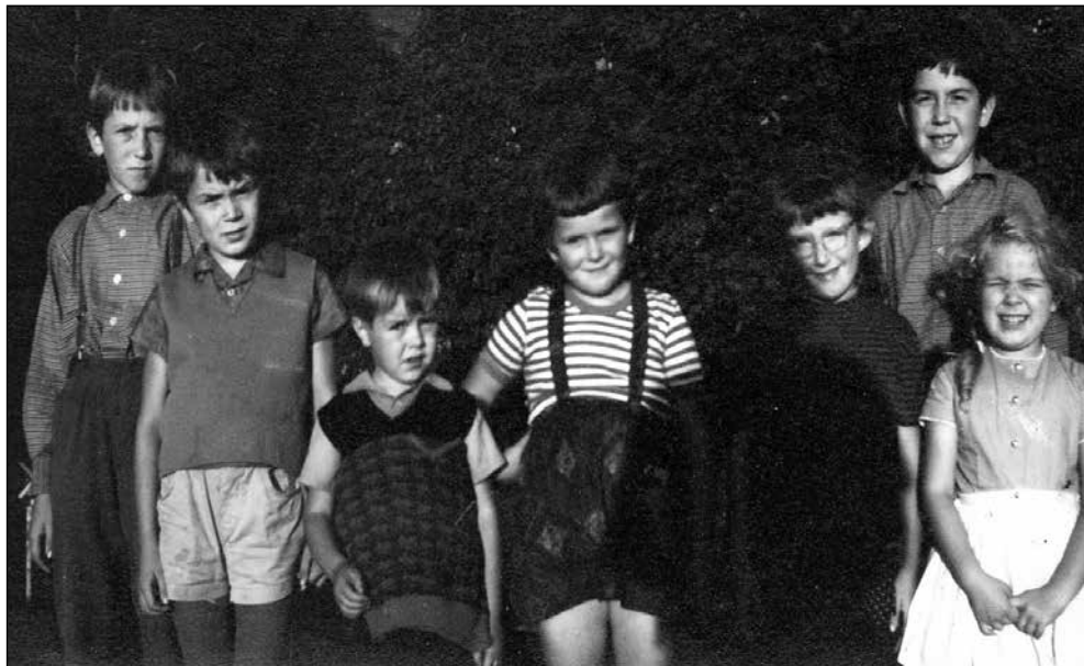
Zabrški šolarji leta 1964.