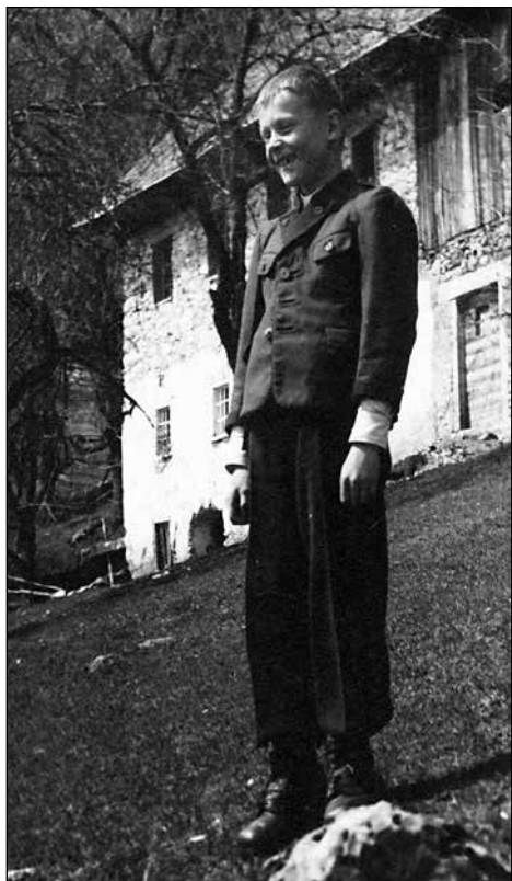
Vrnitev iz izgnanstva leta 1952, v Zgornjih Danjah.

Zapis iz šolske kronike Osnovne šole Zabrdo za šolsko leto 1951/52. Vir: SI_ZAL_ŠKL/0211, Osnovna šola Zabrdo, šolska kronika (1946-1971), t. e. 4.