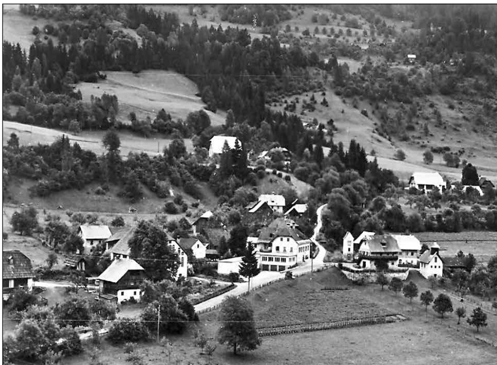
Einöde – Winklern na avstrijskem Koroškem. Mesto, kjer se je Matevž šolal in ga tudi kasneje večkrat obiskal.