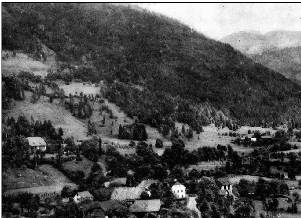
Treffen, kraj njegovega bivanja v izgnanstvu.