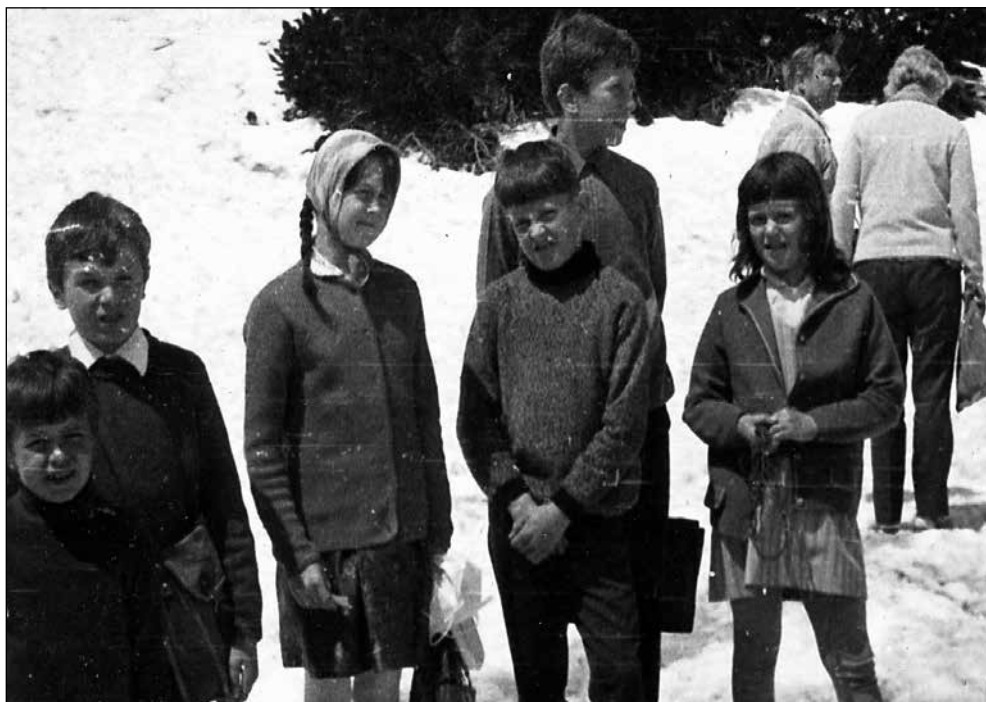
Športni dan, leta 1967.