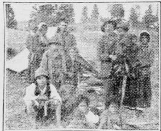
Familija iz plemena Hudorovičev

Puranodat Hudorovičev — Življenje faraonskih potomcev