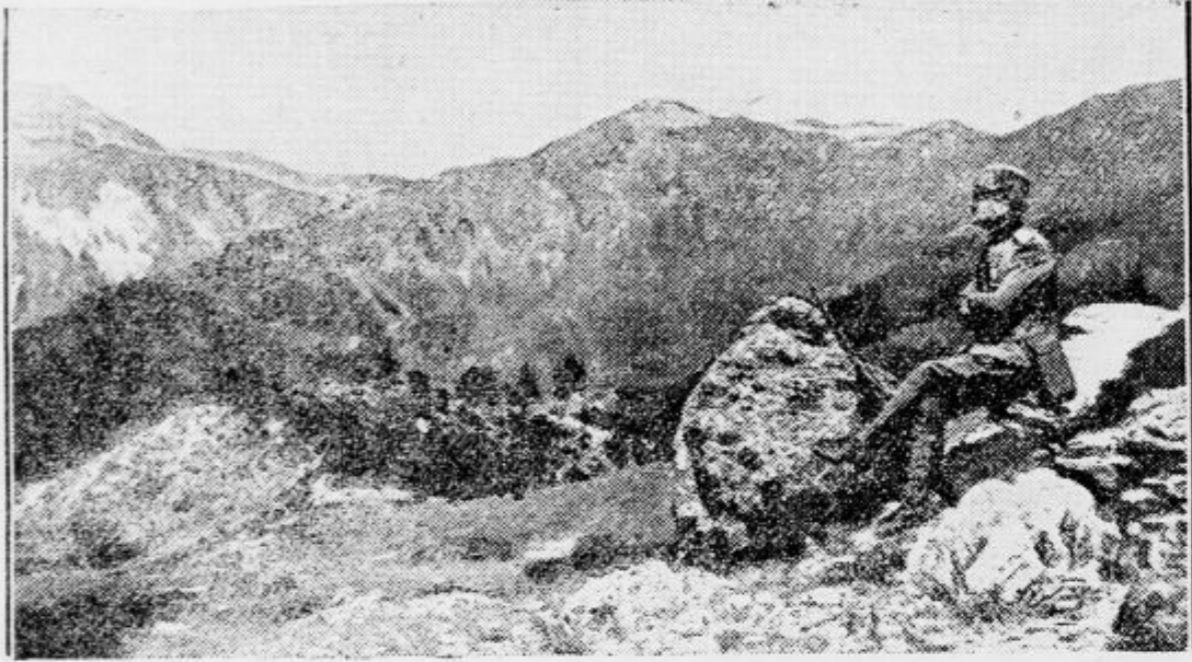
Planina Sokol: pogled z višin pod Dobrim poljem, gledano proti severozapadu. Na sredi vrh Sokola (1825). Srbski častnik gleda proti Kajmakčalanu.

Srbski planinarji vabijo naše turiste v goste — Izletniki se bodo razdelili v dve skupini pod izvrstnim vodstvom