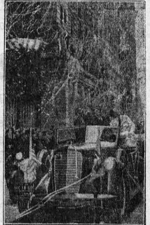
Ameriškega milijonarja Howarda Hughesa, ki je pred nedavnim preletel v letalu zračno pot okoli sveta v rekordnem času, so v Newyorku sprejeli s tolikim navdušenjem, ki ga je redko kdo deležen. Na podobi vidimo, kako na njegov avto trosijo z oken konfete in papirnate trakove. Tak je imela ameriška prestolnica spet svojo veliko senzacijo.

Končno še to: albanski kralj Zogu je privatno tako bogat, da je svoje prejemke v zadnjih letih popolnoma prepustil državnim blagajni.