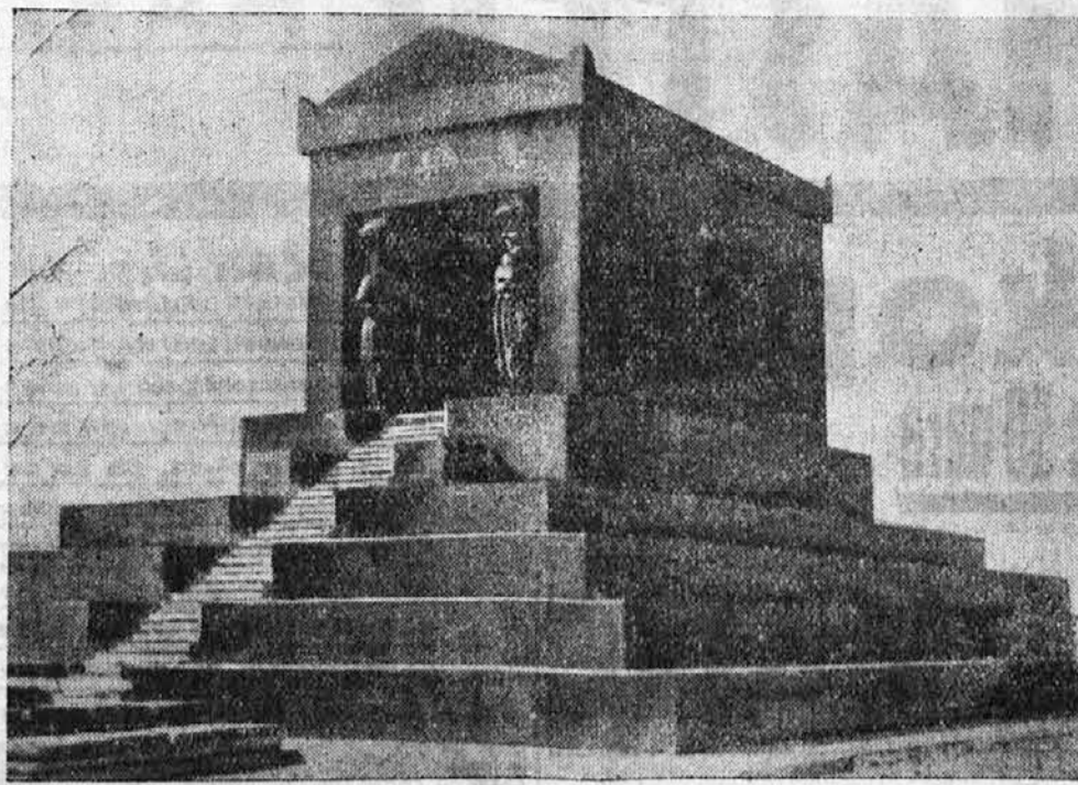
Mavzolej jugoslovanskega neznanega vojaka. Pred dnevi so bili svečano prenešeni v nov mavzolej na Avall pri Beogradu zemski ostanke jugoslovanskega neznanega vojaka. Mavzolej, ki ga vidimo na podobi, je mojstrsko delo kiparja Meštovića, ter je eno najlepših del te vrste v Evropi.

Kakor poročajo iz glavnega mesta Egipta, se bo novembra t. l. vršil v Kairu svetovni islamski kongres, ki se bo bavil v prvi vrsti z vprašanjem Palestine ter s stališčem islama v orientu napram politiki evropskih sil. Arabski listi že sedaj kritikujejo najostreje držanje Anglije. List »Mohattam« piše, da je Anglija izdala muslimane arabskega plemena. »Anglija izgublja prijateljstvo sto milijonov muslimanov, ki so v svetovni vojni zavarovali zmago Anglije. Danes so Arabci žrtve absurdne politike Anglije.«