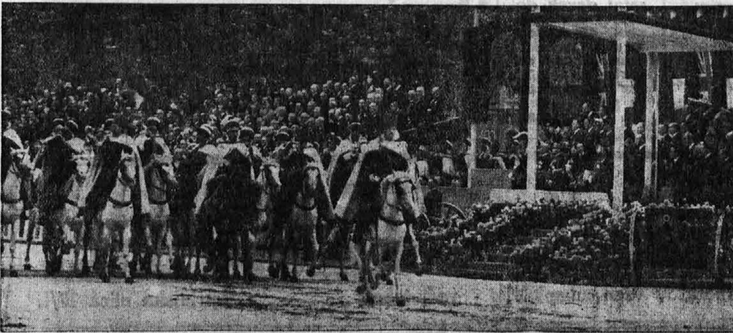
Največja francoska vojaška parada. Za obisk kraljevskega para iz Anglije je francoska armada privedla v Parizu največjo vojaško parado po svetovni vojni. V paradi so sodelovali vse edinice francoske armade.