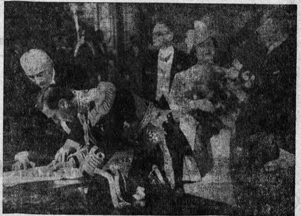
Kraljevski obisk v Parizu. Angleški kralj Jurij se vpišuje v zlato knjigo Pariza. Za njim stojita angleška kraljica in predsednik francoske republike Lebrun.

Slemenci so sploh nezadovoljni ljudje. Godrnjali so na župana in na otroke, kaj se mešajo v stvari, ki jih čisto nič ne brigajo. Čarodeji so pa ostali. Narodne svetinje je treba ohraniti. Še marsikaj dobrega se je zgodilo na Slemenu in vse so blagoslovili čarodeji. Sploh so nena-domestljivi. Stari so že, ne razumejo dobro sveta, a Bog ve, kako da ne more nihče živeti brez njih.