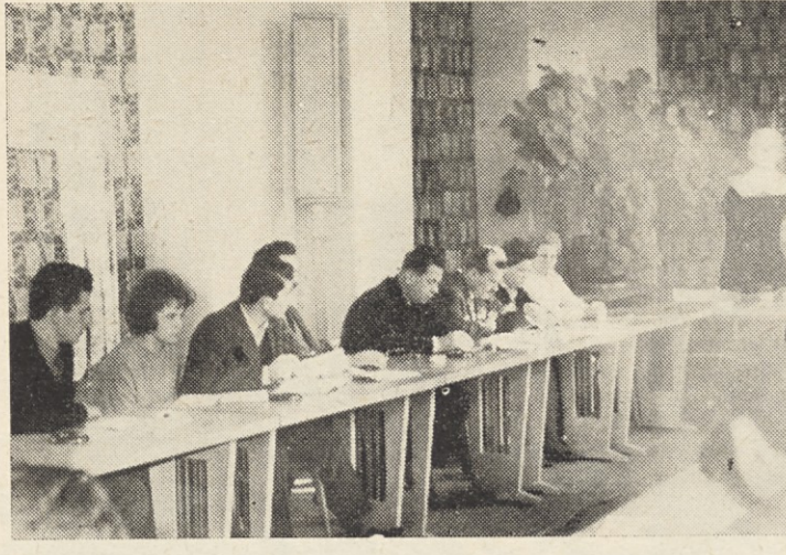
▲ Čeprav navidezno skromna udeležba na letni konferenci OO ZKS tehničnih izdelkov, toda sprejeti sklepi zato toliko bolj bogati