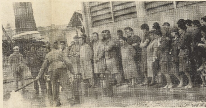
▲ Tudi dež ni mogel zmotiti naših prostovoljnih gasivcev, da v tednu požarne varnosti ne bi organizirali demonstracij o gašenju z ročnimi gasilnimi aparati za člane kolektiva

● V. P. iz valjarne II je vlagal vreteno s kordom v odvijalno na-