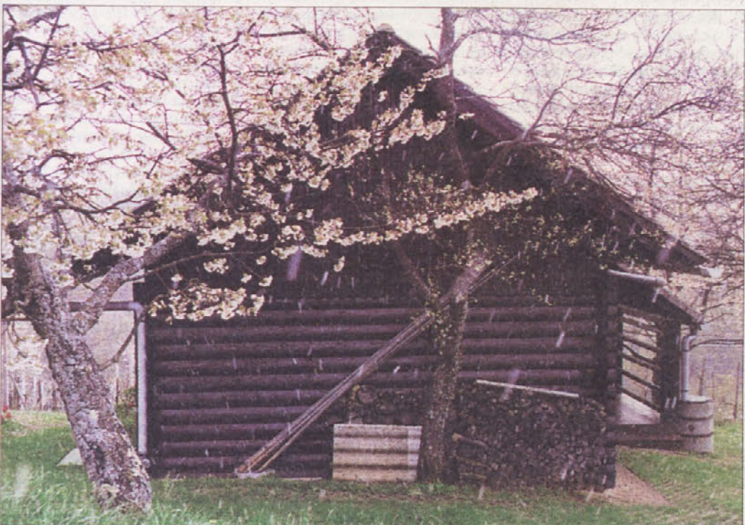
VELIKONOČNI SNEG - Letošnji velikonočni prazniki so minili v hladnem in neprijetnem vremenu. V noči od petka na soboto je tudi naše kraje prizadela slana, ki je naredila nekaj škode predvsem v sadovnjakih, zlasti so prizadete breskve, in v vinogradih, predvsem v nižjih legah. Na velikonočno soboto popoldne pa se je izmejavalo sončno vreme s snežnimi plohami, kot je ta na fotografiji, posneti v gorjanskem Podgorju.