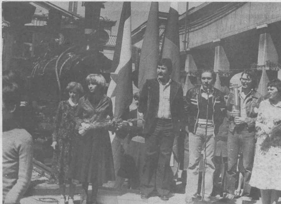
Slovesna prireditev je bila tudi na kolodvoru.