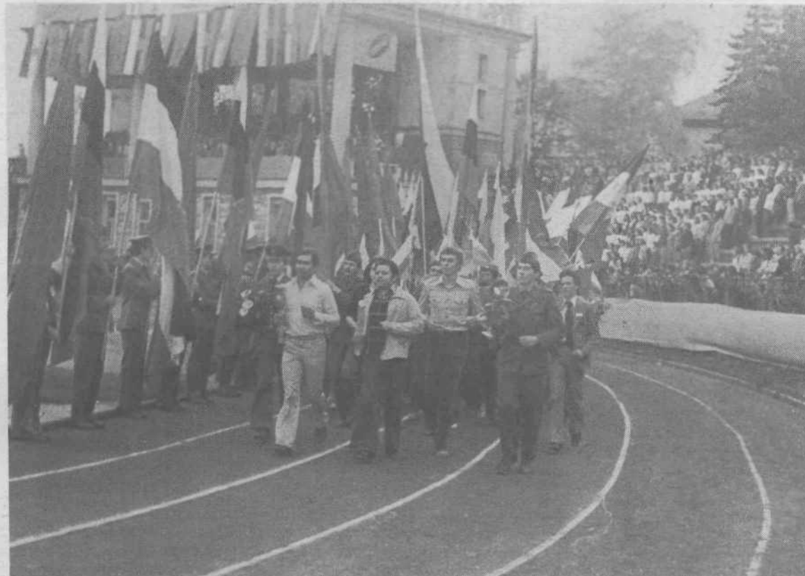
Osrednja prireditev na stadionu je prikazala ustvarjalnosti mladih, s posebnim poudarkom na delu družbenih organizacij in društev. Predstavili so se pevci, jadralni modelarji, karateisti, taborniki in drugi.