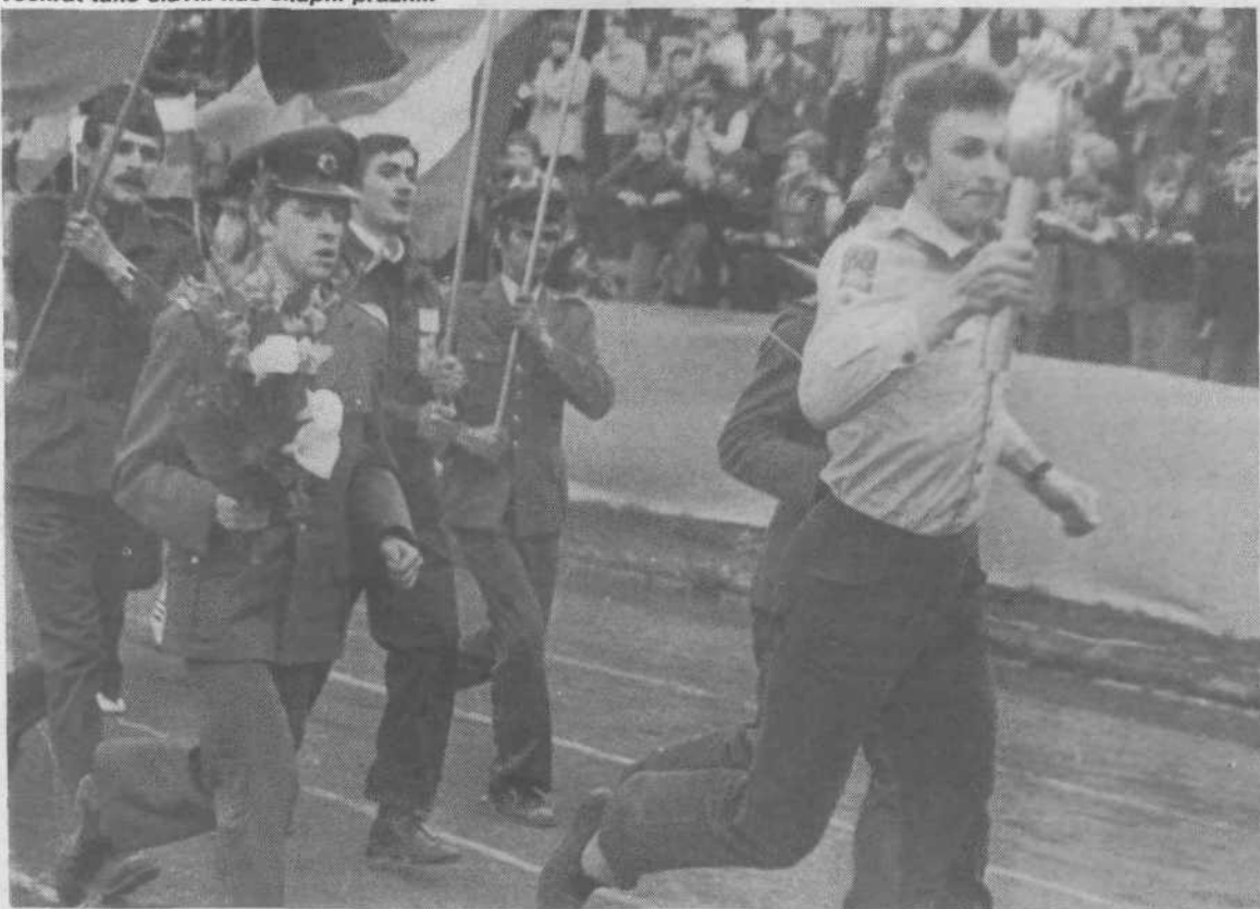
Štafetno palico s pozdravi predsedniku Titu so prinesli na osrednjo prireditev, ki je bila letos na Centralnem stadionu za Bežigradom. Nenehno so štafeto spremljali mladi in pripadniki JLA z zastavami in šopki rož.