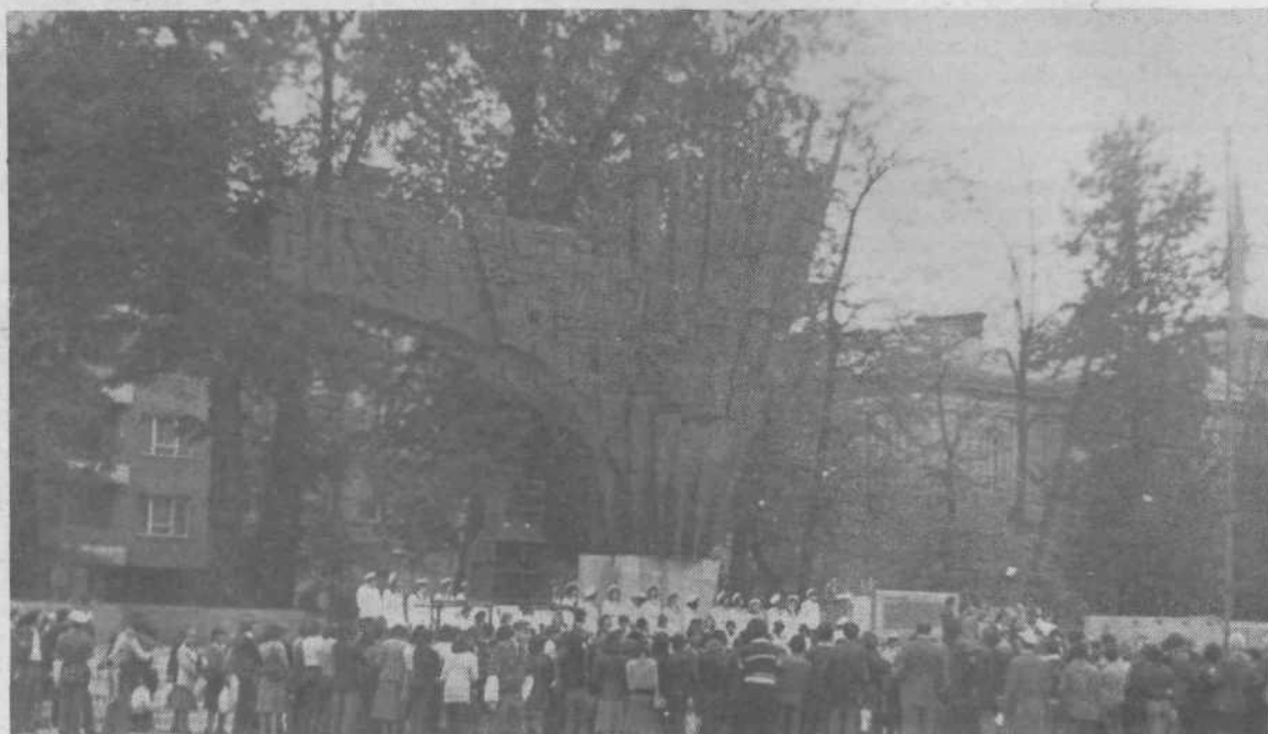
Štafeto so slovesno pozdravili tudi pred spomenikom revolucije.

Vesna Klemenčič, 5. b OŠ Prežihov Voranc