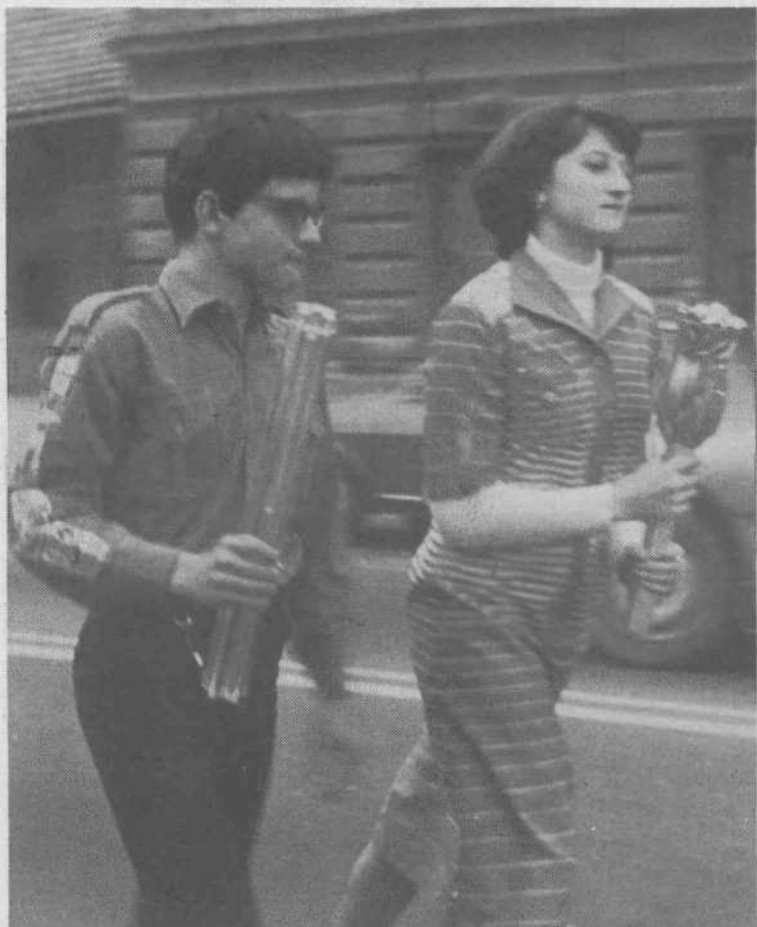
Utrinek s skupne poti obeh štafet po Prešernovi cesti. Lokalna štafetna palica, ki ima v prerezu obliko peterokrake zvezde, je letos obiskala mlade vseh krajevnih skupnosti v občini in večino delovnih organizacij, kjer so jo sprejeli z navdušenjem in bogatimi kulturnimi programi.