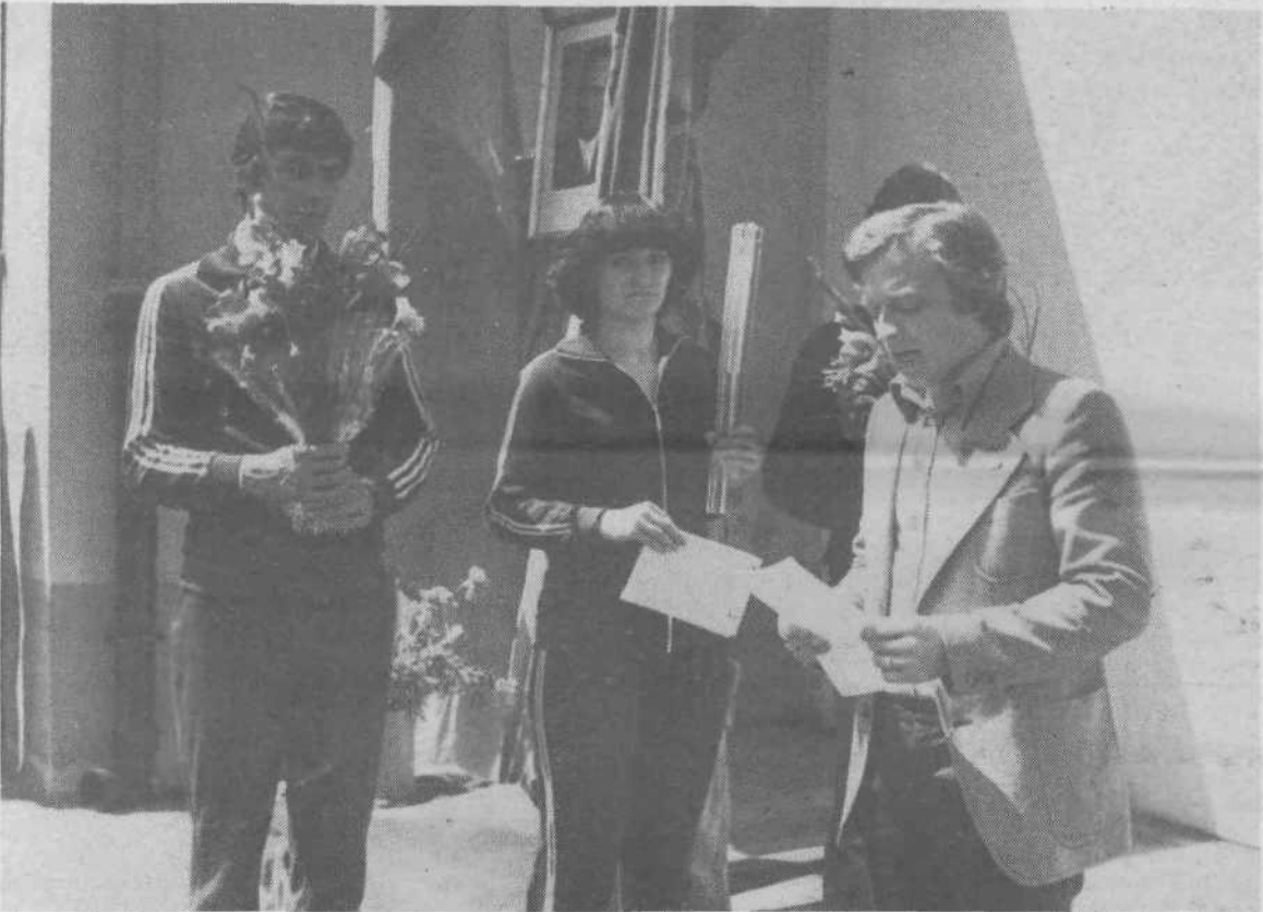
Na vsaki prireditvi so prebrali pozdravno pismo tovarišu Titu in ga predali naprej z najboljšimi željami, da bi še večkrat tako slavili naš skupni praznik