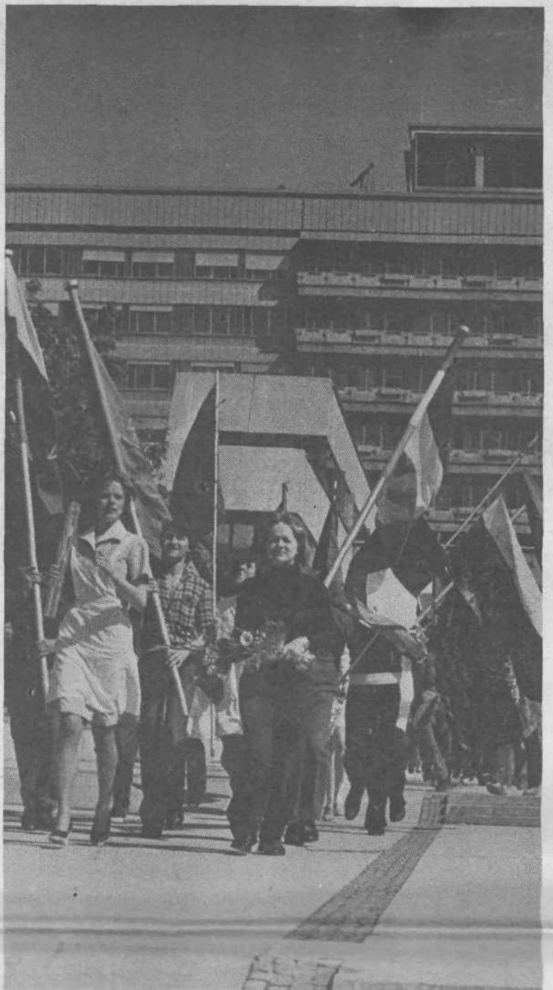
Lokalno štafeto mladosti so nosili tudi mladi delavci Kliničnega centra.