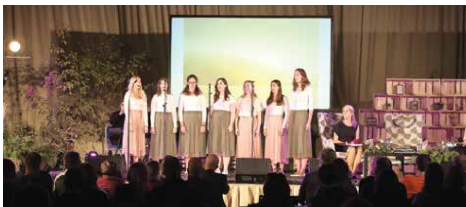
Nastop Vokalne skupine na mednarodnem dnevu Biosfernih območij.

Na povabilo Javnega zavoda Triglavski narodni park so dekleta Vokalne skupine DO RE MI nastopila na njihovem dogodku ob Svetovnem dnevu biosfernih območij, ki je 22. oktobra potekal v Dvorani