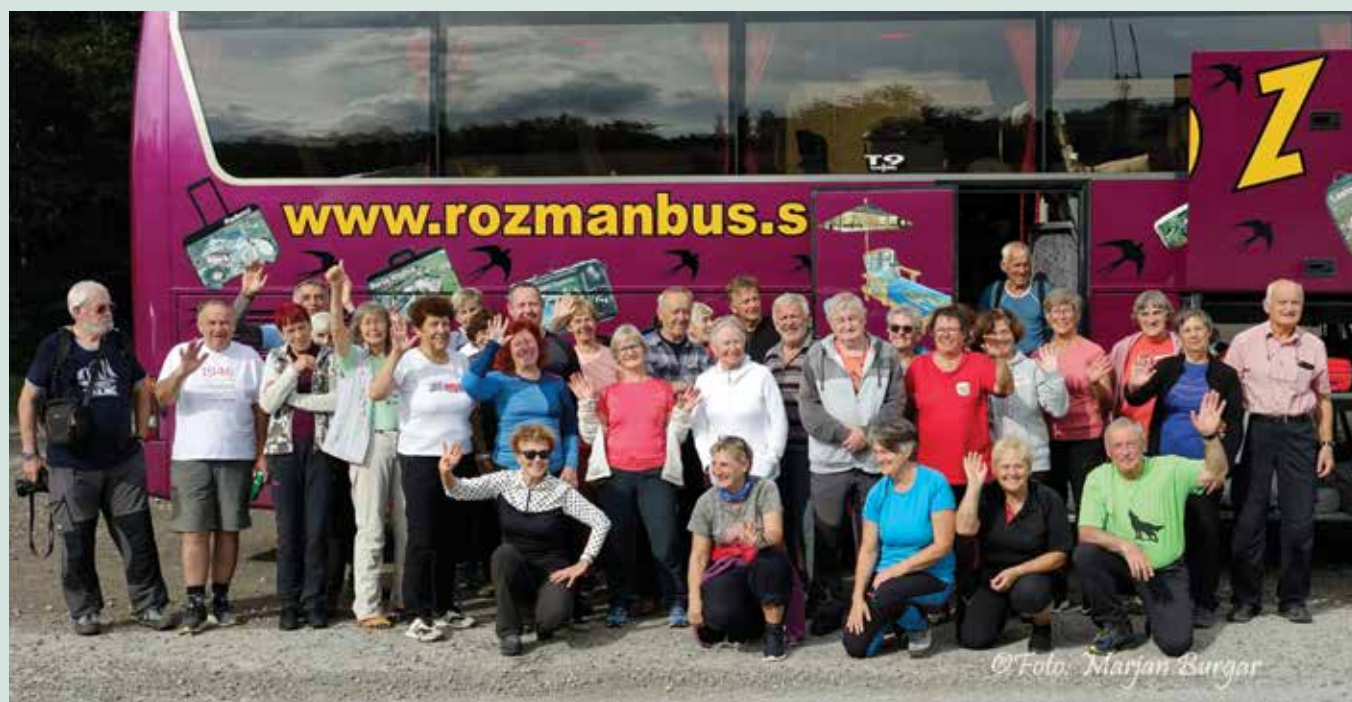
Planinsko društvo Bled vsako leto načrtuje izlet v začetku jeseni. Letos so obiskali Severni Velebit.