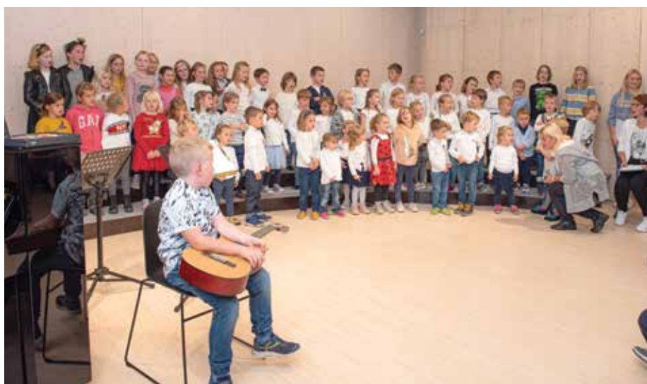
Glasbena pravljica Medvedki na semnju, Medgeneracijski center Vezenine Bled.

Vitranc v Kranjski Gori. Svoj domači kraj so zastopale z izvedbo pesmi Po jezeru.