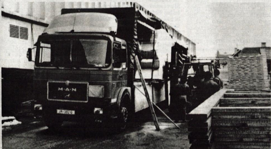
Škofjeloška Jelovica je v BiH poslala prve tri montažne objekte, v katerih bodo osnovne šole, postavili jih bodo na ključ.

Gorenjska Banka d.d. Kranj VARNOST ZA ZAUPANJE