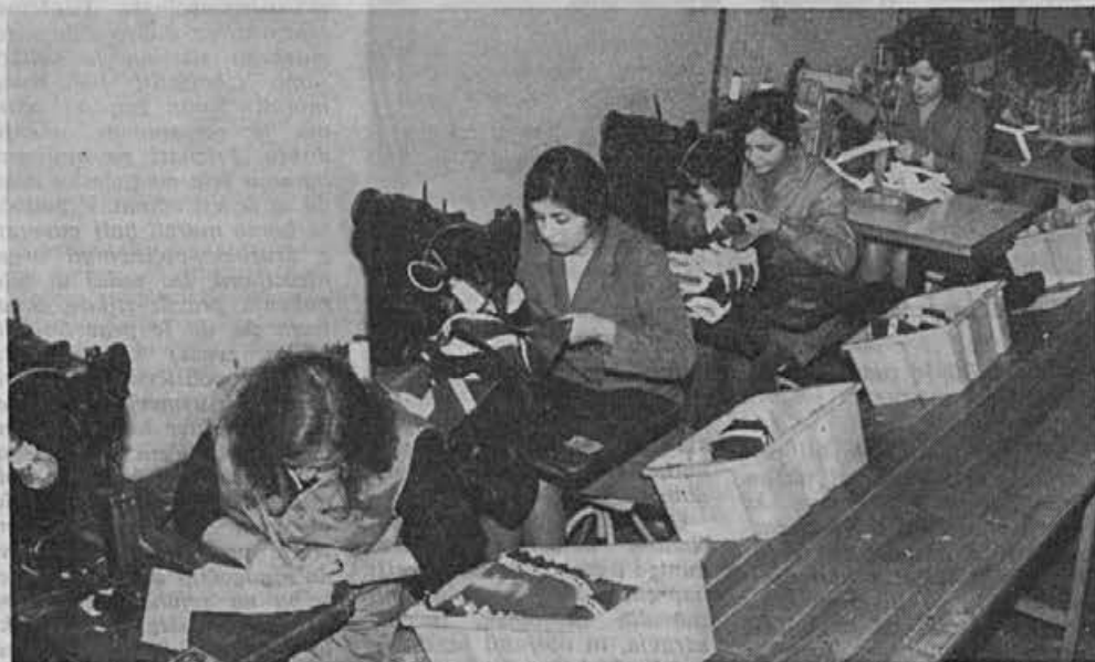
Iz obrata na Colu — v letošnjem letu si je 20 delavk pridobilo kvalifikacijo