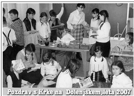
Pozdrav s Krke na Dolenjskem leta 2007