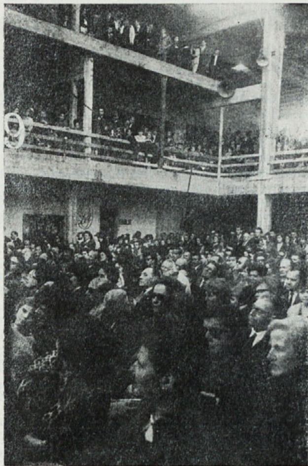
Pogled na del občinstva med popoldansko prireditvijo ob deveti obletnici „Našega doma“

Teharje, Celje, Hrastnik, Trbovlje, Zagorje, Jesenice, Radovljica, St. Vid, Medvode, Škofja Loka, Podutik, Krim, Turjak, Grčarice, Jelendol, Mozelj, Kočevje, Kočevski rog, Gorjanci in drugi številni kraji so in bodo ostali za večne čase mejniki dobe in spomeniki našim narodnim mučencem, ki so bili pobiti samo zato, ker so imeli sto in tisočkrat prav. Padli so za: Boga, Narod in Domovino.