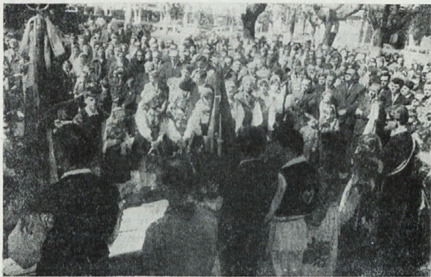
Slovesna sv. maša na trgu v San Justu