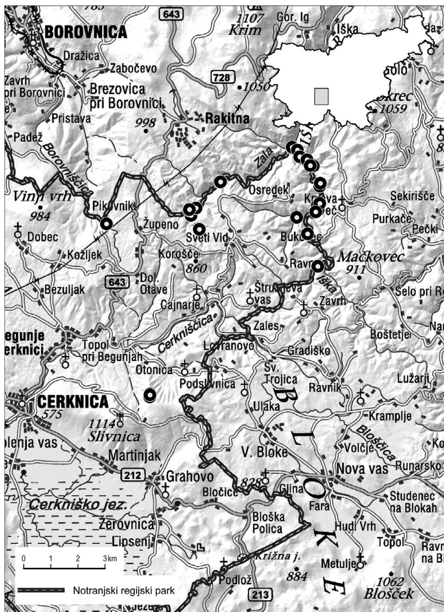
Slika 2: Popisana nahajališča kranjskega jegliča v raziskovanem območju