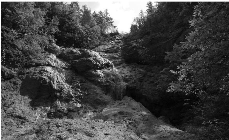
Slika 3: Slap v Kotlu v soteski potoka Zala, kjer uspeva kranjski jeglič Figure 3: Waterfall in the gorge Zala, the locality of Primula carniolica

v preteklosti pisala SIMIĆ (1991) in ACCETO (2010, 2013). Potok Zala od slapu Kotel do izliva v Iško leži v ekološko pomembnem območju Krimsko hribovje – Menišija (Ind. št. 31200).