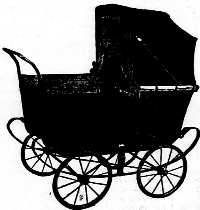
tovarna dvokoles, otroških vozičkov in delov. CENIK FRANKO.