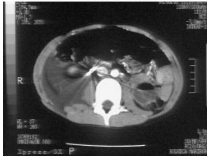
Sl. 2. Kovinski tujek v zgornjem delu sečevoda.

V diagnostičnem postopku smo uporabili slikovne preiskave, ki ustrezajo trenutni doktrini obdelave poškodb sečil (CT) (1), vendar pa je ob začetni evalvaciji poškodba sečevoda vseeno ostala neprepoznana, kar pa opisujejo tudi drugi avtorji