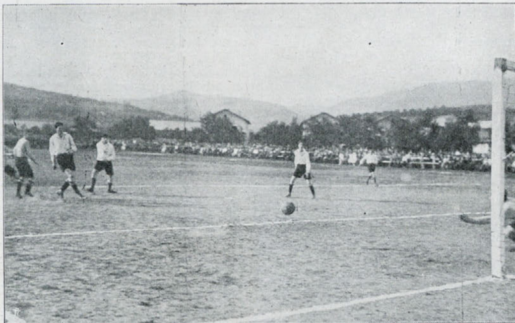
Moment iz tekme Gradjanski - S. A. Š. K. v Šarajevu.

Gradčanom manjka smisel za kombinacijo, razen tega imajo zelo primitivno tehniko. Prvi dan so mogli na suhem terenu razviti vsaj start na žogo in vzdržati otvorjeno igro, drugi dan pa so publiko naravnost razočarali. Po dežju zmečkanemu terenu so se prilagodili domači, ki so odločno boljši v tehniki in kombinaciji, mnogo bolje, potisnili so Gradčane v defenzivo in zmagali po volji. — Mariborskemu Rapidu bi priporočali, da pridobi za Maribor v bodoče boljše