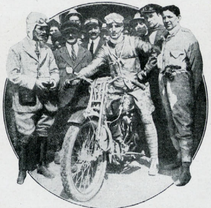
Nazzaro, zmagovalec v Circuito di Crema, najtežji motorni dirki v Italiji.

»Čitamo u zagrebačkim novinama i izvanrednom izdanju »Športskog lista« posve izmišljene i lažne izvještaje o ponašanju publike i igrača Hajduka spram Gradjanskoğa prije, to-