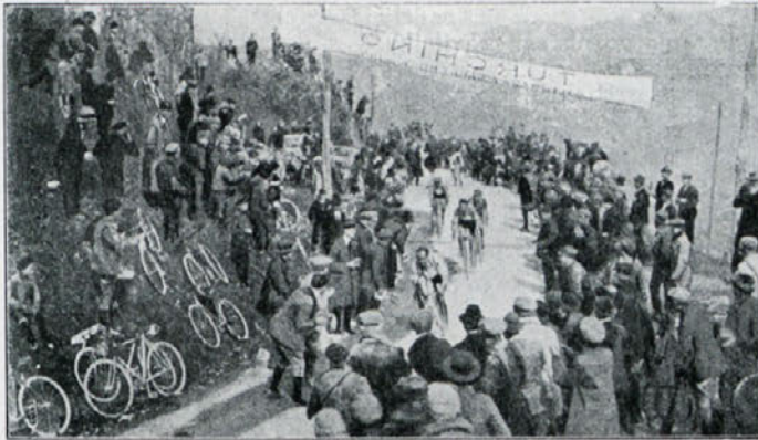
Slovita gorska dirka na Turchinu v Italiji.

Priprave za ta veliki sportni sestanek so se vršile že dva meseca. Na kongresu bo odstopil dose-