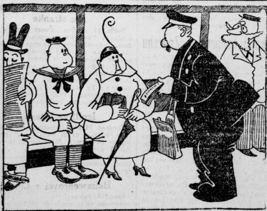
•Koliko let ima vaš sin? •Pet. •Tako, tako... potem je pa ali postolovec ali pa — velikani!