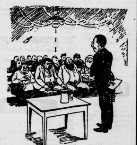
«Gospoda, apeliram na vašo inteligenco.»

Istot m dobite tudi najnoveše ENO-DVO- IN TRO-ELEKTRONSKE APARATE po priznanih nizkih cenah.