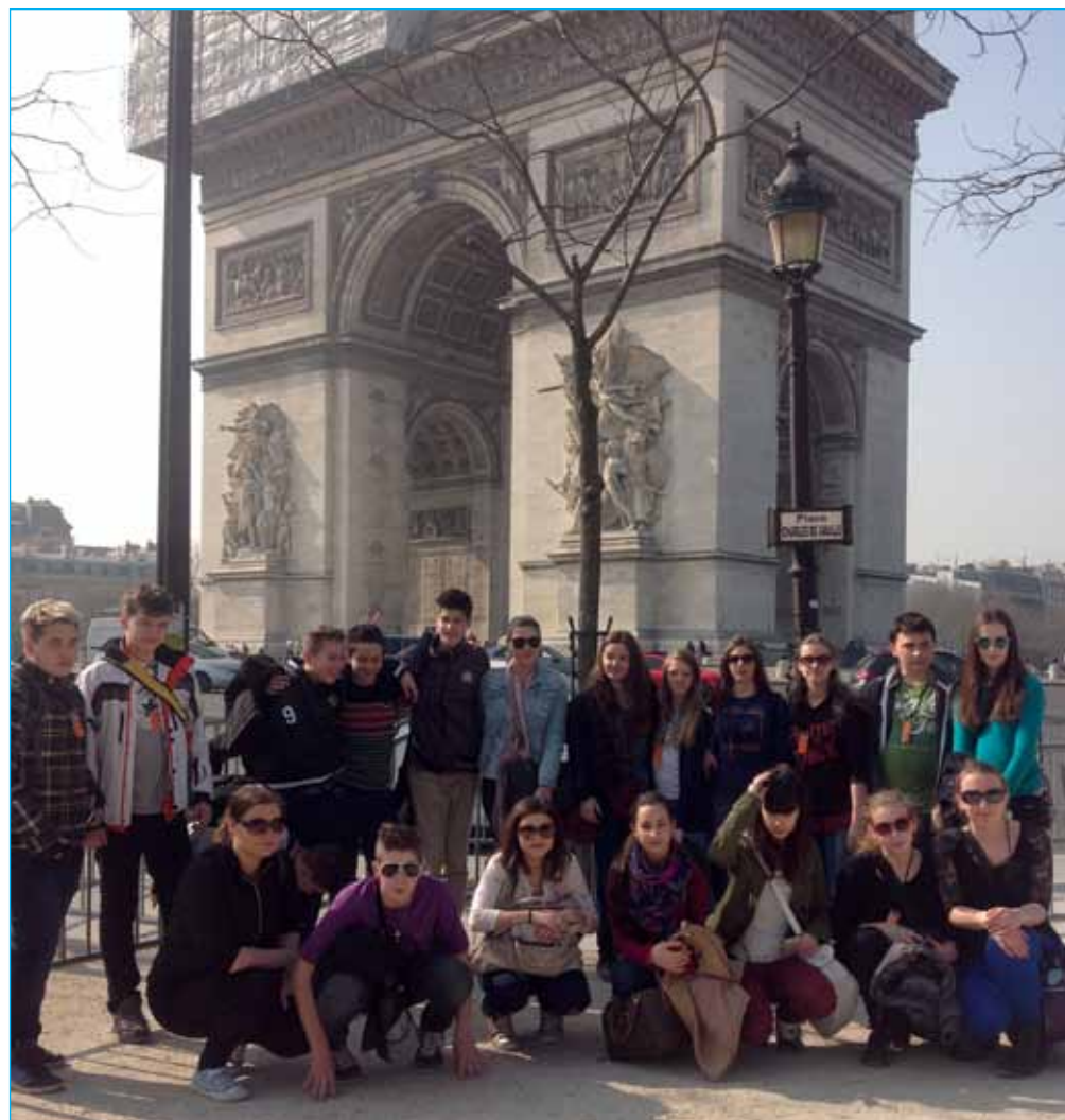
Osmošolci in devetošolci pred slavolokom zmage v Parizu