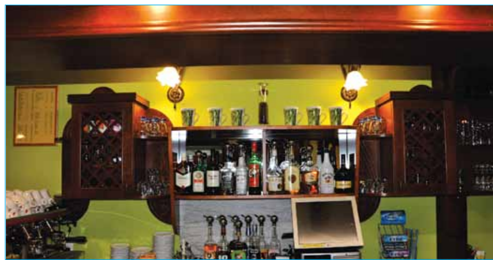
Prenovili so tudi notranjost lokala ...

Ker nas leto veže na že kar nekaj naših tradicionalnih dogodkov, se seveda trudimo, da kupcem pripravimo dogodke, ki se jih radi spominjajo in se posledično tudi vračajo v našo prodajalno. Obljubljamo, da bomo s tem nadaljevali in našim zvestim strankam omogočili, da se bodo pri nas še naprej dobro počutile. Danes smo priča poplavi trgovin in trgovskih centrov, ki ležijo predvsem na obrobjih mest. Kakšen je pritisk konkurence na trgu? Vsekakor si prizadevate, da z večjo kvaliteto blaga ali nižjo ceno izdelkov ter boljšimi storitvami privabite čim več obiskovalcev v svoje prodajne prostore. Ne