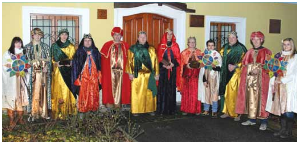
Koledniške skupine Kralji

Za leto 2014 si je društvo zadalo več nadržov in izzivov, za kar bo potrebno vložiti nekaj truda in časa. V družbi prijetnih ljudi pa nam to ni težko, saj nas družijo pesem in zabava, zaradi česar nam ni nikoli dolgčas. Kmalu po novem letu smo zavihali rokave in začeli z rednimi vajami, s čimer se pridno pripravljamo na nastope, ki se bodo zvrstili v naslednjih tednih. 23. marca smo se udeležili revije cerkvenih pevskih zborov na Destrniku,