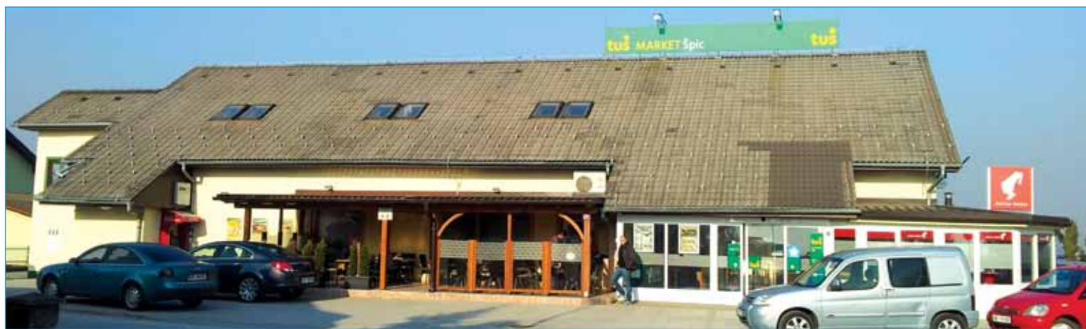
Ime prodajalne izvira iz lege le-te, svojo ponudbo pa predstavljajo na 300 m 2 .

Občani in mnogi okoličani smo lahko tekom let spremljali vaše delo, saj je podjetje doma na točki, mimo katere se dnevno pelje nemalo ljudi. Kako