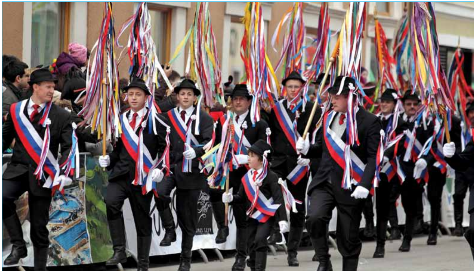
Kopjaš – edinstven ženitovanjski lik