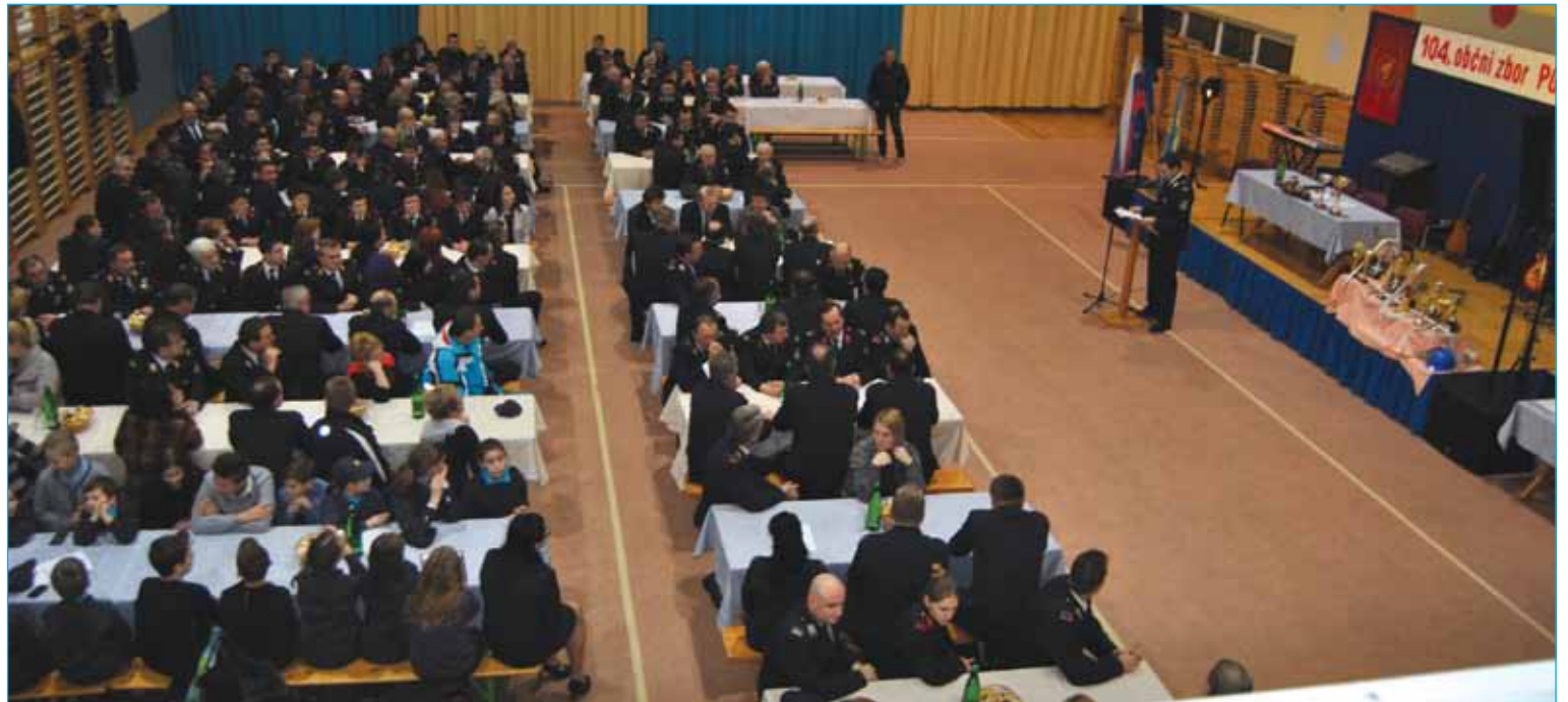
Utrinek s 104. občnega zbora PGD Bukovci