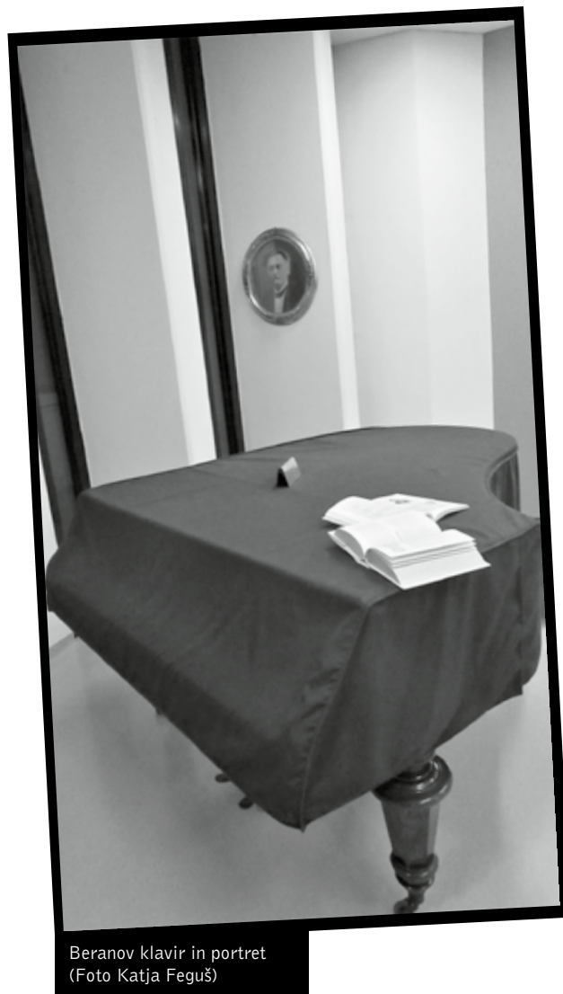
Beranov klavir in portret

Pomembno je omeniti še Repozitorij Univerzitetne knjižnice Maribor , ki se vedno bolj dopolnjuje in bogati. V njem lahko najdemo zapuščine, rokopisne zbirke, osebne zbirke in ostala