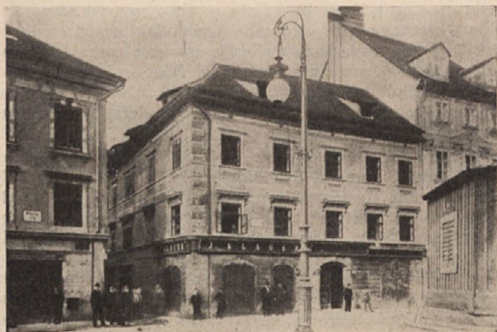
Špitalska ulica, vhod z Mestnega trga:

Soseda stari hiši št. 277 v Špitalski ulici, obenem že vogalna hiša med Špitalsko ulico in Mestnim trgom je bila hiša št. 278, ki smo jo