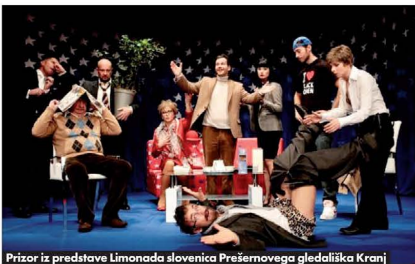
Prizor iz predstave Limonada slovenica Prešemovega gledališča Kranj