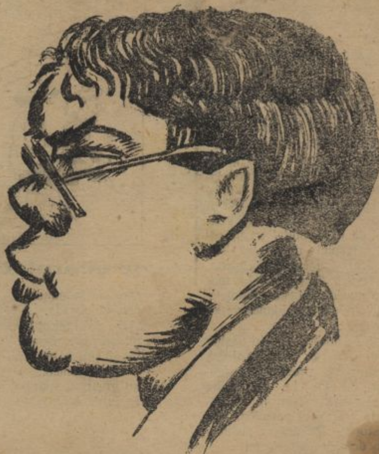
Marij Kogoj, prvi slovenski skladatelj.