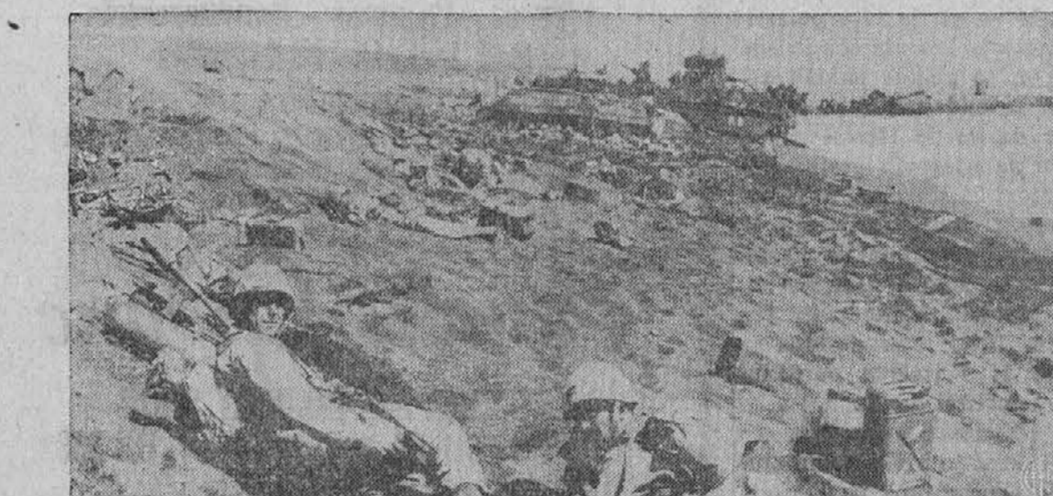
Ameriški vojaki, ki so pristali na obrežju Iwo Jima otoka so si morali iskati za- vjetja pred japonsko artilerijo v kupih peska. V ozadju slike je videti razbite tanke in ladje, kajti Japonci so v tem predelu branili otok z vso srditostjo.