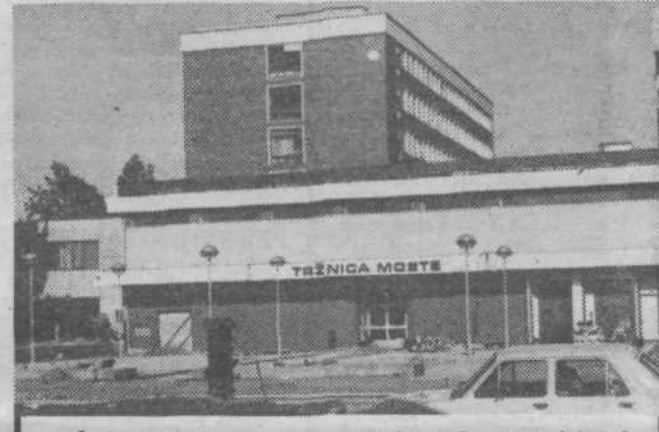
Če ne bo več nobenega čez..., se bodo tule čez mesec dni med prodajalci že drenjali kupci.

O prostorih bivše lekarnje na Zaloški cesti št. 47 je razpravljal izvršni svet naše občinske skupščine. Občinski samoupravni stanovaljski skupnosti, ki upravlja s temi prostori, je predlagal, da jih odda Ljubljanski banki — Gospodarski banki za poslovalnico na našem področju, vendar pod pogojem, da bo v njih opravljala gotovinsko poslovanje z občani.