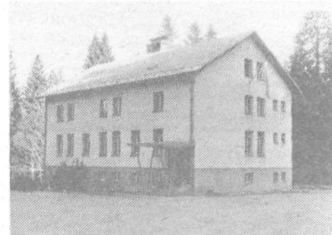
Dom v Leskovi dolini