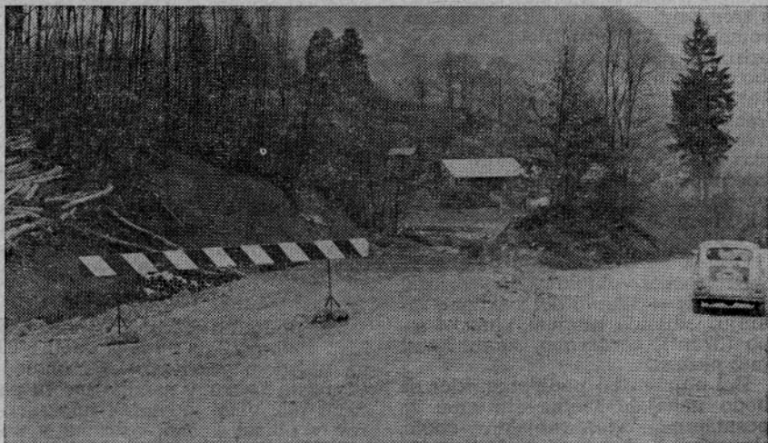
Cesto gradi gradbeno podjetje »Gradis« iz Ljubljane, ki bo z deli končalo predvidoma do konca maja letos