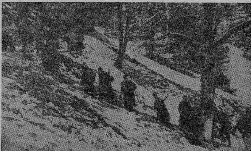
MED BORBO OB GRAČNICI PRI LOKAVCU — Divizija se pomika v hrib na boljše položaje, med tem pa bataljon v zasedi z mitraljezi tolče na krdelo nemških vojakov in vermanov, da bi zaščitil prehod svojih preko Gračnice

Svabska predhodnica, močna okoli sto petdeset mož, je bila obdana s šolsko deco iz Lokavca. Nemci so jih zbrali v Rimskih Toplicah in jih vlekli s seboj. Obdali so se z živim zidom naših slovenskih otrok, ki naj v primeru napada zaščitijo s svojimi telesi esesovsko svojat. V strahu in