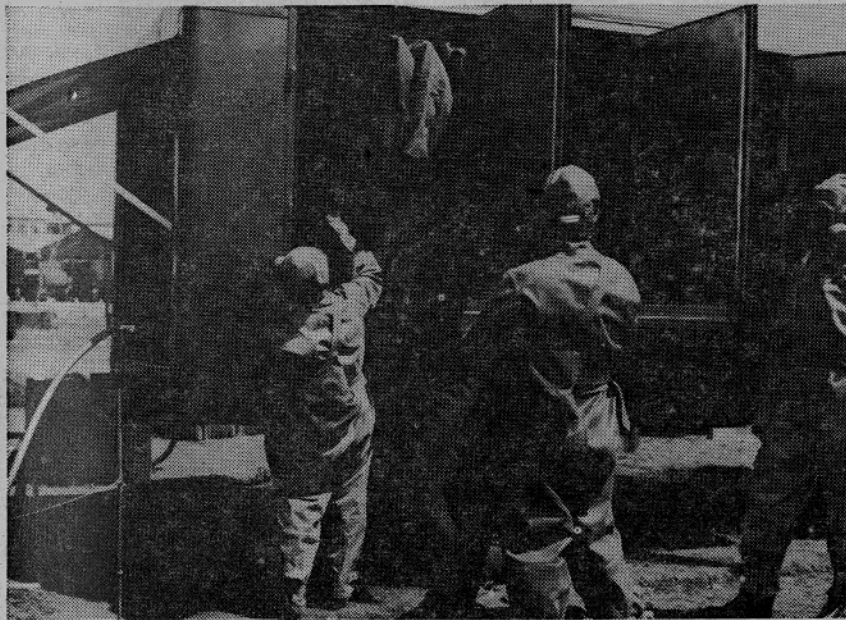
VLAGANJE OKUZENIH OBLEK V KOMORE ZA RAZKUŽEVANJE