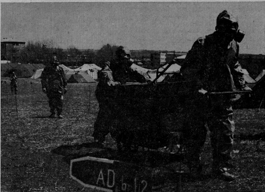
PRENOS OKUŽENE OPREME IN OBLACIL

Naloge te službe so reševanje ponesrečenih ljudi in imetja izpod ruševin, odstranjevanje ruševin, odstranjevanje in uničevanje neeksplozivnih borbenih sredstev, hitro po-