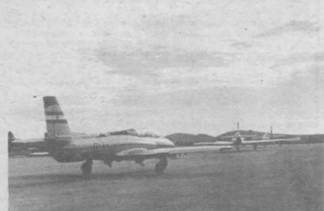
Pred vzletom. Tudi naši mladi Močani so že samostojni piloti v letalnih oziroma gojenci v letalskih šolah