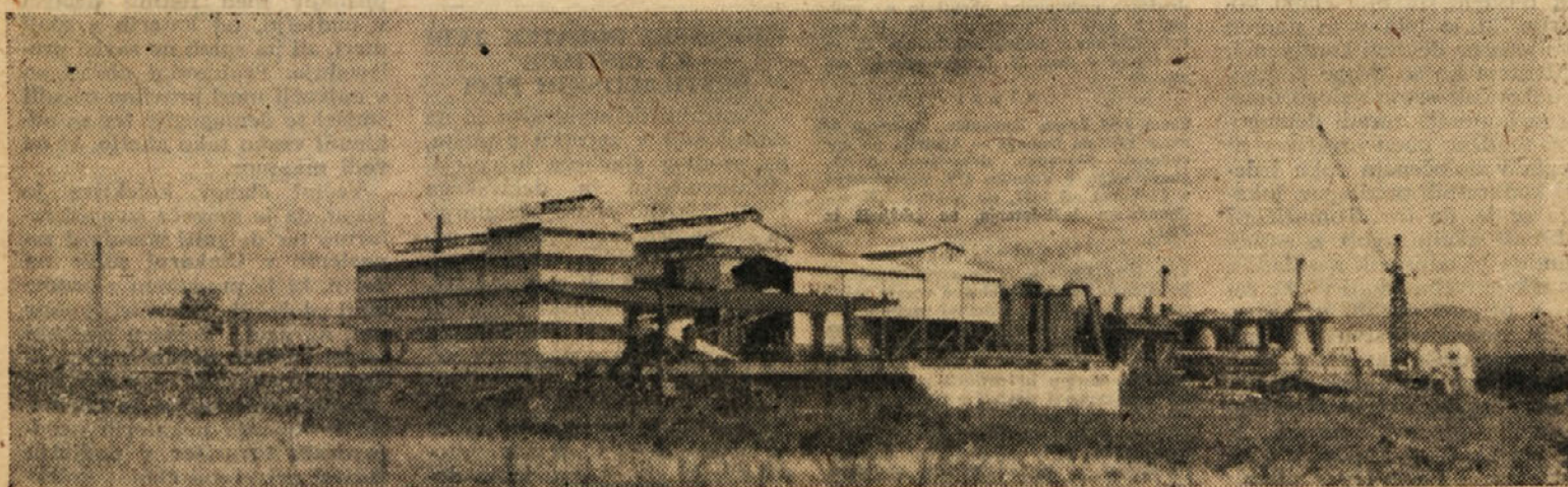
Prva faza rekonstrukcije našega podjetja polagoma dobiva svojo dokončno obliko. Proti koncu julija je pričela poskusno obratovati piritna linija v novem obratu žveplene kisline, te dni pa bo pritekla prva kislina iz novih naprav. Na sliki: Pražarna cinkovih koncentratov, piritna pražarna in obrat žveplene kisline.