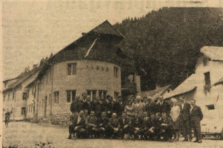
Pred dnevi je v Solčavi začel obratovati naš novi počitniški dom »Rinka«. Podrobnosti berite na 6. strani. Na sliki: predstavniki naših družbeno političnih organizacij, po otvoritvi doma.

lootnemu kolektivu je danes popolnoma jasno, da z večjim številom lopat to je z večjim fizičnim prizadevanjem posameznikov kakor tudi celote, ni mogoče izvesti reforme, temveč da mora biti cilj reforme večja proizvodnja, večja proizvodnost