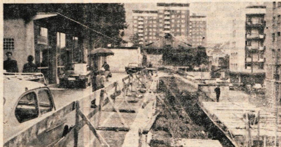
Nasproti železniške postaje pod jeseniško tržnico gradi SGP Sava 74 enonadstropnih garaž in deset prostorov za službe komunalne obrti.