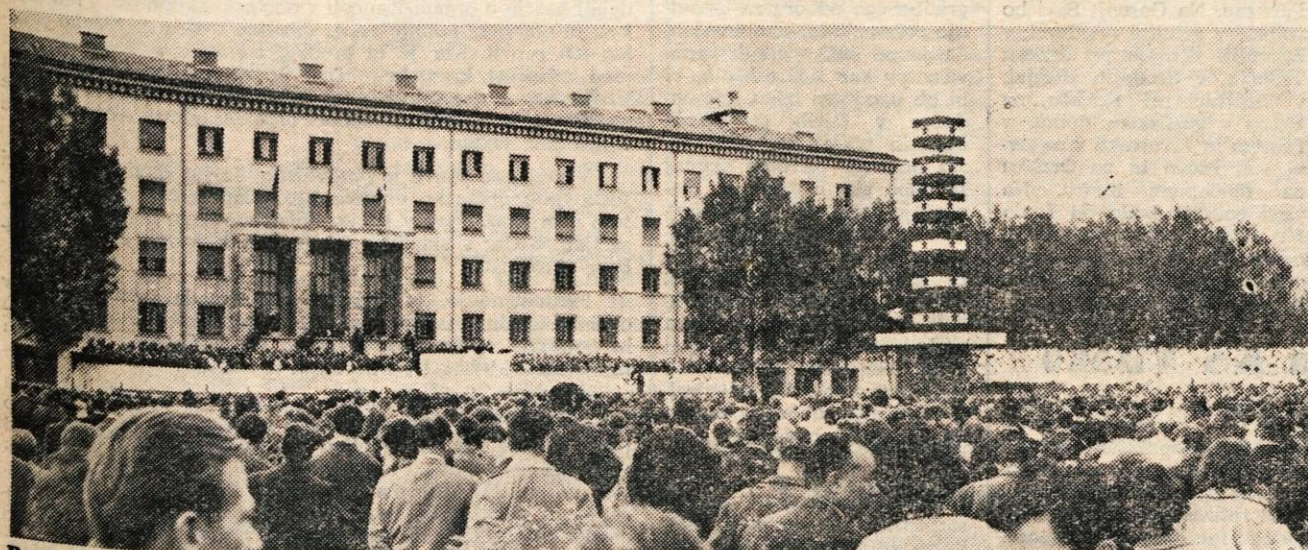
Proslave ob 25. obletnici vstaje primorskega ljudstva se je udeležilo okrog 150.000 ljudi iz vseh koncev naše domovine. Med njimi je bilo tudi veliko Gorenjcev. Praznik je izzvenel v mogočno manifestacijo miru in prijateljstva med narodi.

GLASILO SOCIALISTIČNE ZVEZE DELOVNEGA LJUDSTVA ZA GORENJSKO