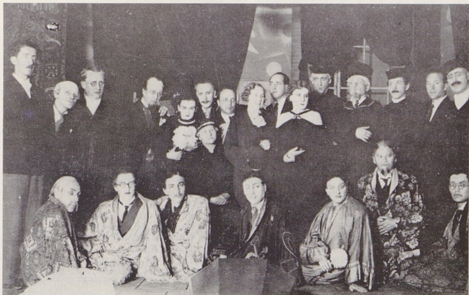
Sodelujoči v Skrbinškovem celjskem jubilejnim »Tajfunu« l. 1935; v sredini njegova mati (s klobukom)