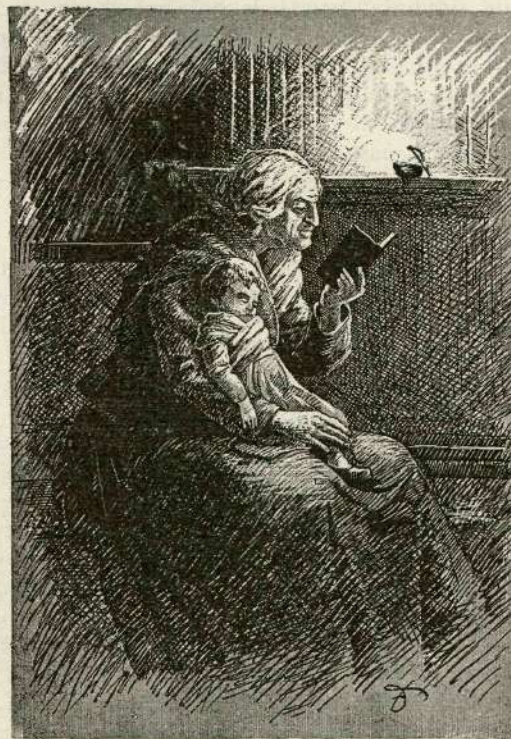
Doma med polnočnico. (Risal J. D.)

O božičnih praznikih je bilo pred desetimi leti, ko smo pripravljali s trdom, s strahom in z nemirom, vendar s pogumom 1. številko 1. letnika. Zaupanje nas ni zapustilo, pa tudi ne varalo. Srečne se štejemo, da je 10. obletnica res vesela božična obletnica. Ob nobenem letnem času ne izvira naše veselje tako iz verskega prepričanja kakor o božiču. Vera kliče narod o polnoči v razsvitljeno hišo božjo, vera vnema domači krog okoli gorke peči, okrog praznične mize; vera vodi znanca v vas k znanu, otroka domov k starišem. Vzemi jim vero, kaj jim ostane? Vzemi narodu vero, ostane mu brezupnost, surovost. Ne, nikdar ne sme naš narod slovenski izgubiti tega nebeškega darú. V ta namen hoče delovati „ Dom in svet “ tudi do druge, tretje in nadaljnje desetletnice, in ko bi mu tudi zgodaj odmrli sedanji urednik, upamo, da pride drugi, ki bo nadaljeval naše delo v čast božjo in v prosep slovenskega naroda.