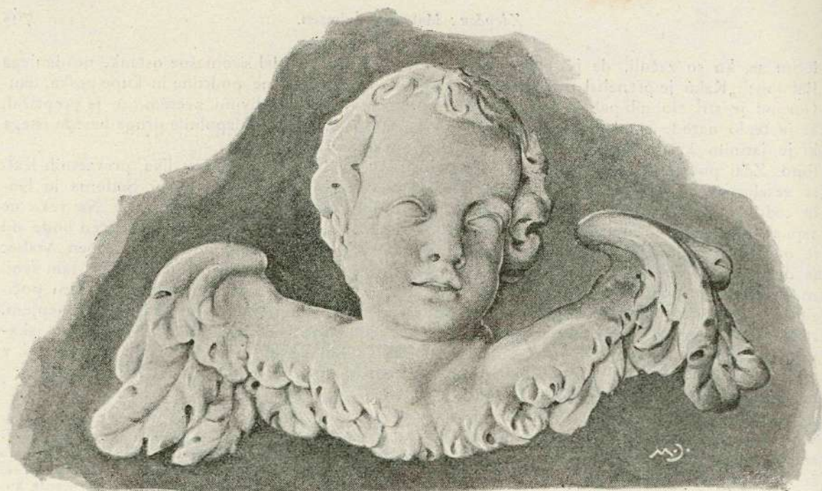
Angelček z oltarja frančiškanske cerkve v Ljubljani. (Izklesal Robba.)