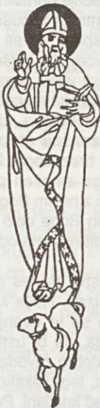
Sv. Izidor 4. aprila