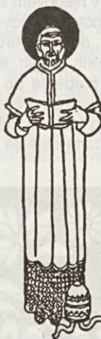
Sv. Leon Veliki 11. aprila