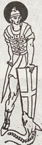
Sv. Jurij 24. aprila