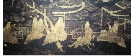
Slika 2: Lesen lakiran pokrov škatle za hudie qin z zlato poslikavo taoističnih nesmrtnikov, Skuškov zbirka, SEM, inv. št. NM 18313.

takoj opazimo, da ne gre za dvostrunski erhu , ampak za instrument s štirimi strunami. Zaradi slabe ohranjenosti tega sprva ni mogoče opaziti, so pa na glavi instrumenta štiri izvrtine za uglaševalske vijake, v katere so pritrjeni trije umetelno oblikovani leseni vijaki z okrasom iz slonove kosti na vrhu odebeljenega dela vijaka, pri čemer četrti manjka, na njegovem mestu pa vidimo le prazno vdolbino, kar potrjuje, da ne gre za dvostrunski erhu . Za sihu bi lahko rekli, da je starejši sorodnik instrumenta erhu , saj oba pripadata skupini instrumentov huqin 胡琴 – družini godal z resonančnim lesenim telesom (cilindričnim, šest- ali osemkotnim), pokritim s kačjo (pogosto pitonovo) kožo ali tanko plastjo lesa, s pritrjenim pokončnim cevastim vratom. Navadno so sestavljeni iz dveh strun in dveh uglaševalskih vijakov, čeprav, kot velja za glasbilo iz Skuškov zbirke, obstajajo tudi različice s tremi, štirimi ali več kot petimi strunami in vijaki. Pri štirih strunah sta prva in tretja uglašeni enako, prav tako imata skladno uglasitev druga in četrta. Pri igranju je žima loka razdeljena na dva dela, prvi je postavljen med prvo in drugo, drugi pa med tretjo in četrto struno.