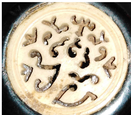
Slika 11: Stilizirane odprtine iz slonovine iz spodnjega dela resonančnega telesa glasbila sheng , Skušкова zbirka, SEM, inv. št. 277 MG (foto: Klara Hrvatin, 2019).

V Skuškovi zbirki so tri tradicionalne različice instrumenta sheng (slika 10), ki verjetno datirajo v pozno 19. ali zgodnje 20. stoletje. Eden od njih (inventarna št. 276 MG) je izdelan iz bambusa in je manjšega formata, druga dva (inventarni št. 277 MG, 297 MG) pa sta izdelana iz palisandra oziroma bambusa, oblečenega v palisander. Vsi imajo značilne okrase: spodnji del resonančnega telesa in ustnik s stiliziranimi odprtini iz slonovine, predvsem pri najbogatejše okrašenem glasbilu sheng z inventarno številko 297 MG (slika 11). Vrhovi piščali, predvsem najvišjih, so zaključeni z