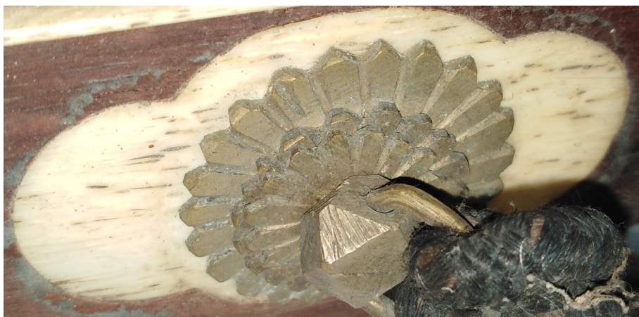
Slika 6: Na ročni boben bajiao gu pritrjena dekorativna navezava vrvi, ki se s tradicionalnim kitajskim vozlom zaključuje v povezan obtežen čop niti, Skušкова zbirka, SEM, inv. št. NM 18316.

Pomen besede pipa naj bi glede na dokumente iz dinastije Vzhodni Han (25–220) izhajal iz tehnike igranja instrumenta, pi za potisk prstov desne roke naprej, pa za pomik nazaj. Instrument sestavljajo kratek vrat, leseno hruškasto telo, včasih z dvema zvočnima luknjicama v obliki polmeseca, in 12 do 26 prečk. Predvsem po letu 1949 je to glasbilo doživelo veliko sprememb; svilene strune so počasi prešle v jeklene, oblečene v najlon, število prečk se je povečalo in s tem tudi obseg instrumenta. Sodobna pipa ima tako od 29 do 31 prečk, 6 na vratu in druge na telesu. Pentatonično uglasitev