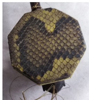
Slika 4: Osmerokotno resonančno telo glasbila sihu , prekrito s pitonovo kožo, Škušova zbirka, SEM, inv. št. NM 18317.

v Mongoliji in Notranji Mongoliji, uporablja pa se tudi kot tradicionalni instrument v kitajskih provincah Liaoning, Jilin in Heilongjiang. Kot spremljevalno glasbilo je uporabljen predvsem v pripovedniških zvrsteh, kot je oblika baladnega petja in govornja ( shuochang 说唱), pri senčnem gledališču ipd. (Montanič, 2013, 22–23).