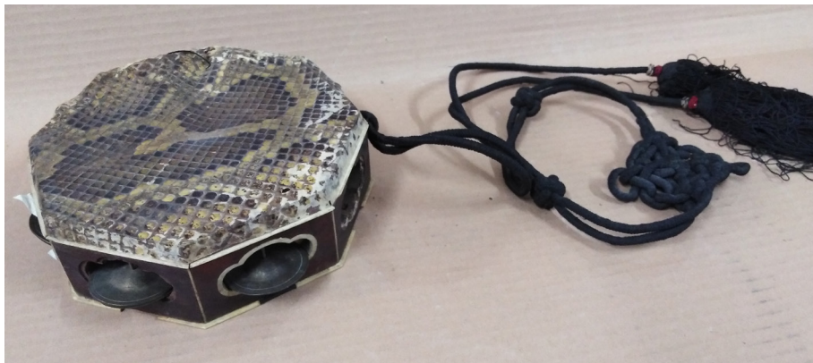
Slika 5: Osmerokotni ročni boben bajiao gu , Skušкова zbirka, SEM, inv. št. NM 18316 (foto: Klara Hrvatin, 2019).