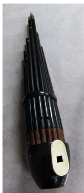
Slika 10: Ustne orgle sheng , Skušкова zbirka, SEM, inv. št. 297 MG.

telo, izdelano iz buče, lesa ali bakra in povezano z ustnikom, v katerega glasbenik piha. Višino tona določimo s pritiskom prstov na luknjice piščali. Cevi sestavlja pet različnih dolžin, ki so razporejene tako, da bi simbolično ponazarjale obliko peruti ptice feniks. Poleg tradicionalnih 13-, 14- in 17-cevnih sklopov so na voljo 21- in 24-cevne garniture ter 36-cevni komplet, ki temelji na kromatični lestvici z vsemi 12 poltoni. Predvsem v sodobnih kitajskih ansamblih lahko med drugim srečamo večji, visoko zveneči sheng ( jiansheng 鍵笙, kar pomeni sheng s klaviaturo), na katerega lahko igramo zahodne akorde (Qiang, 2011, 23–27). Veliko sprememb je instrument doživel po ustanovitvi Ljudske republike Kitajske. Število piščali se je povečalo na 32, s čimer sta se glasbilu povečala tonski razpon (možna je uporaba diatonične lestvice) in glasnost (Montanič, 2013, 6). Instrument ima bogato zgodovino, saj naj bi obstajal že v dinastiji Han (202 pr. n. št.–220). Iz kitajskega instrumenta se je razvilo več podobnih instrumentov, kot sta japonski shō in korejski saenghwang , najdemo pa jih tudi v predelih Tajske, Laosa in Vietnama.