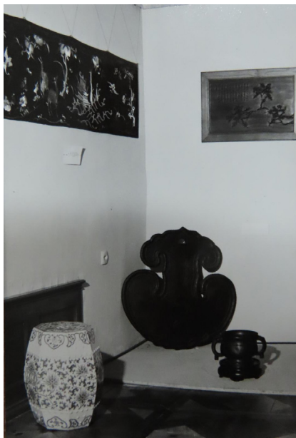
Slika 14: Gong, Skuškova zbirka, SEM, 297 MG, razstavljen v Muzeju Goričane.