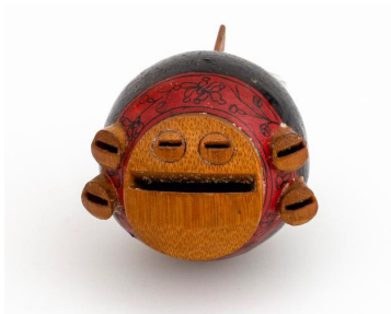
Slika 12: Golobja piščal večjih dimenzij s tremi pari podpiščali (bučni tip), ki jo odlikuje barvitost in cvetlični vzorci, Skuškova zbirka, SEM, inv. št. 236 MG.

na katero so pritrjene podpiščali iz bambusa. Najštevilčnejši so primerki bučnega tipa golobjih piščali manjšega formata, tj. v velikosti oreha, s tremi podpiščalmi in cvetličnimi vzorci v črni barvi na rdeči ali rumeni podlagi (več o Skuškovi zbirki golobjih piščali v Hrvatin, 2020).