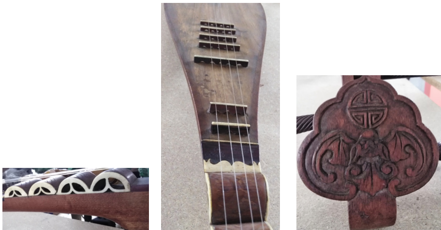
Slike 7, 8, 9: Umetelno izdelana pipa : stilizirane odprtine iz slonovine (slika 7), intarzija iz slonovine v obliki netopirja (slika 8) ter motiv na glavi instrumenta z motiviko netopirja in simbola shou (slika 9), Skuškova zbirka, SEM, inv. št. NM 18315.

Slabše ohranjena pipa iz Skuškove zbirke je podolgovate hruškaste oblike in brez zvočnih lukenj. Ima 12 lesenih prečk, zaključenih s slonovino na telesu, štirje loki slonovine pa tvorijo še štiri prečke na vratu, tako jih je skupaj 16. Glava instrumenta je ukripljena nazaj in okrašena z motivi iz slonovine. Poleg slonovine na glavi in prečkah so iz slonovine držalo za strune na spodnjem delu trebuha instrumenta, konice lesenih vrtelj za uglaševanje ter predel pod štirimi loki, okrašen z deli iz slonovine; iz slonovine je tudi glavni okras na glavi instrumenta z motivom zmaja. Druga pipa iz zbirke je neprimerno bolje ohranjena in je bila tudi bolj vzdrževana. Nanjo so vpete strune, verjetno dodane kasneje. Prav tako kot prva je zelo umetelno oblikovana, v kombinaciji lesa in slonovine (sliki 7 in 8), pri čemer sta na njeni glavi motiv iz lesa v obliki netopirja in simbol shou 壽: prvi je simbol sreče in veselja, drugi pa dolgoživosti (slika 9).