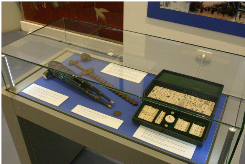
Slika 13: Sheng iz Skuškovske zbirke, SEM, 297 MG, na razstavi Čez morje na neprepoznavni Daljni vzhod v Piranu (levo spredaj v vitrini).