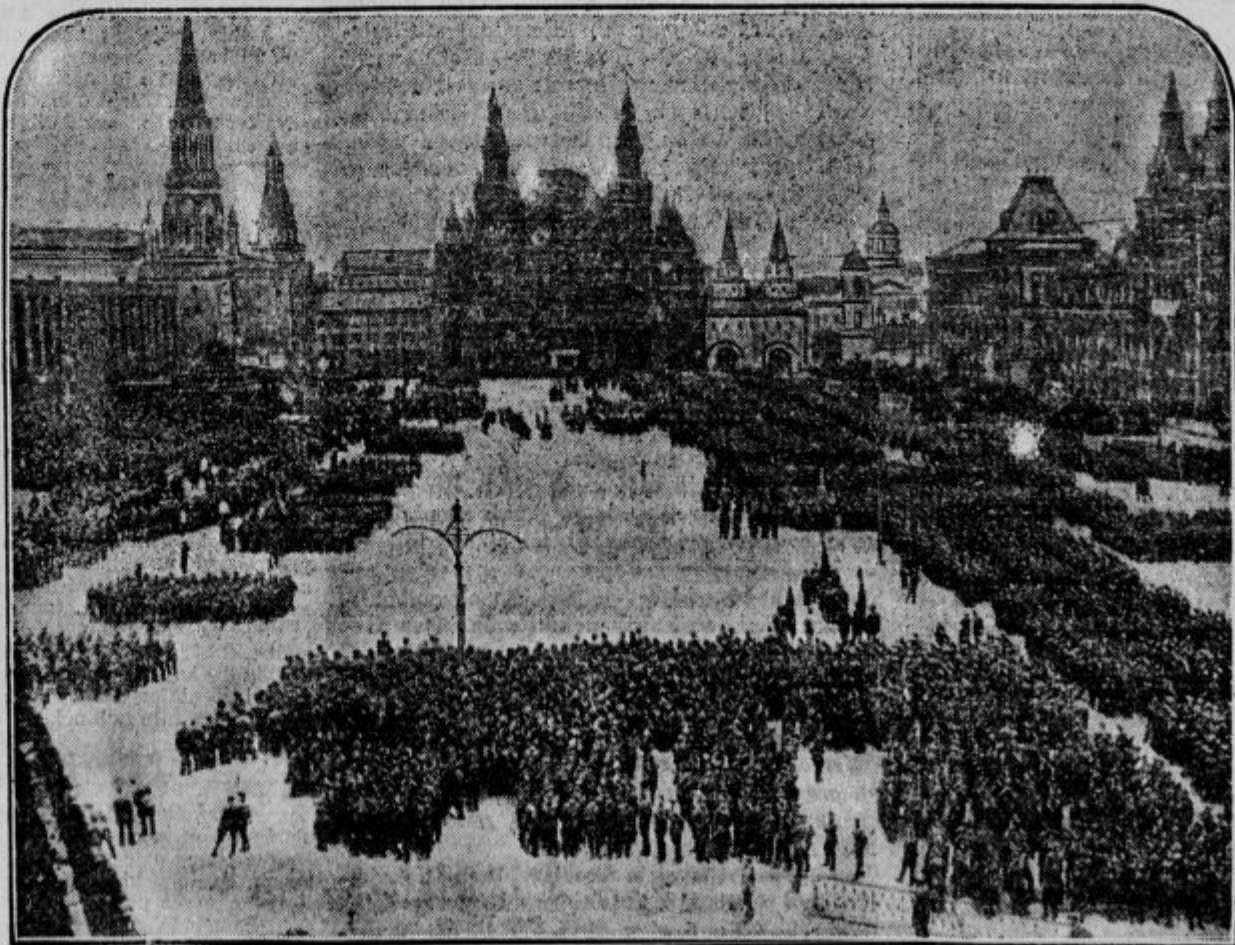
Parada sovjetske armade na Rdečem trgu v Moskvi.