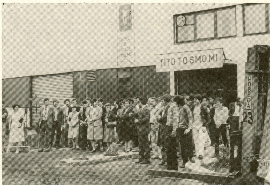
NA OGLEDU TOVARNE ŽEBLJEV IN ARMATUR – V Bihaču je leta 1968 zrasla prva večja tovarna z združevanjem dela in sredstev RMK Zenica. V delovni organizaciji Krajina metal so si naši delavci z zanimanjem ogledali proizvodnjo žebeljev in armatur. V tovarni predelajo letno okrog sto tisoč ton železa. Poprečni mesečni zaslužek kovinarjev je okrog 12.000 dinarjev. V tovarni namenijo večji del dohodka tudi za izgradnjo stanovanj.

S pričetkom proizvodnje hladilnih aparatov v novi tovarni tu v Bihaču, bo proizvodnja le-teh v