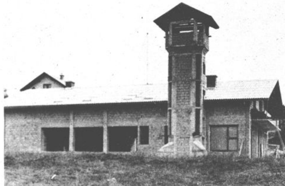
Nov gasilski dom in nova avtocisterna bosta prispevala k večji požarni varnosti občanov