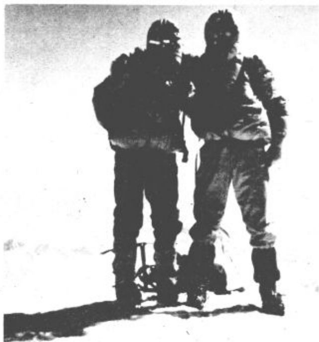
Veselite se vrhu 7105 m visoke Korženevskeje je bilo neizmerno.

Vreme pred našim odhodom v strmine kar ni hotelo biti lepo. Bilo je oblačno, vetrovno in tu in tam je celo snežilo. Zato smo bili zaskrbljeni. Ali bomo uspeli, v tem zaradi česar smo prišli sem? Objektivne okoliščine nam lahko seveda našo namero preprečijo. Mnoge odprave v Himalajo se vrnejo praznih rok. Tega mi ne bi hoteli! — Sovjetski tovariši so nam pripovedovali, da tako