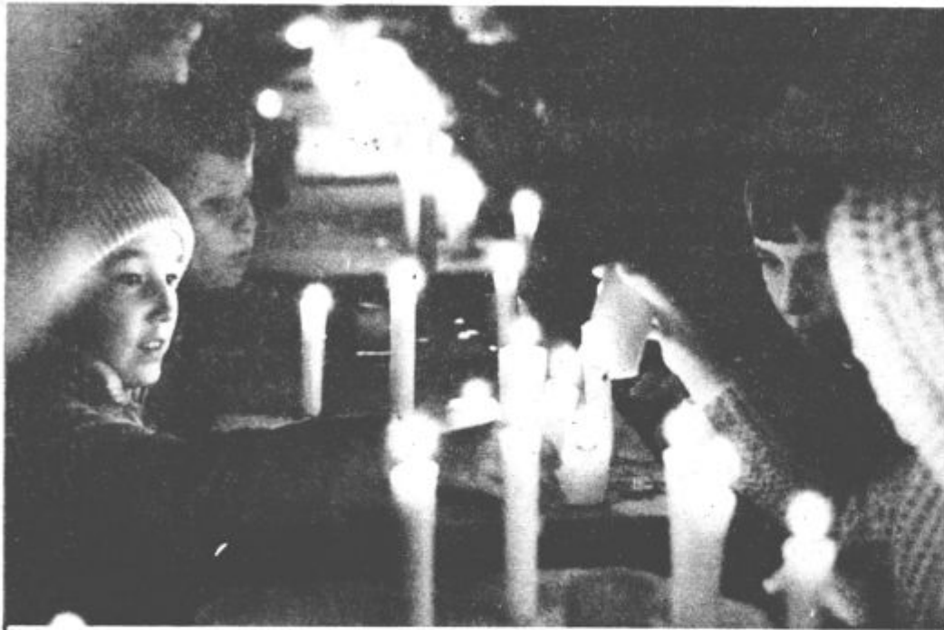
S šopkom rož in prižgano svečko, smo se ob dnevu mrtvih spomnili vseh umrlih svojcev. Tudi najmanjši so v teh dneh obiskali spominska obeležja, kjer so se ob prižganih svečkah spomnili vseh padlih za svobodo.