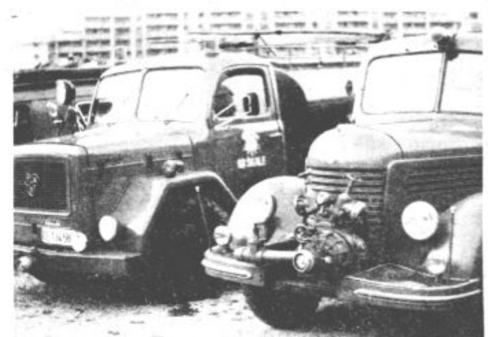
V gasilstvu je potrebna mehanizacija

V teh dneh so organi skupščine SIS za varstvo pred požari že pristopili k podrobnejemu načrtu porabe sredstev in aktivnosti za prihodnje leto.