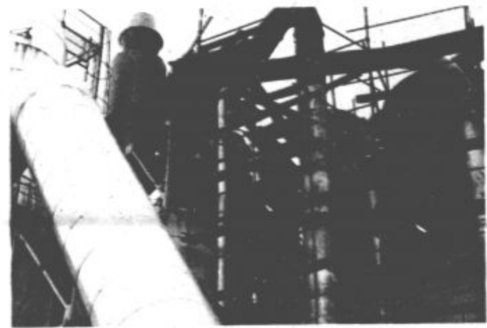
Tokrat so se izkazala domača podjetja

Vranskega. Pozabiti ne smemo tudi na veliko pomoč sosednje temeljne organizacije Energetika in vzdrževanje. Stokratno obnovo bodo močno izboljšali kakovost surovin ivernih plošč, v veliki meri odpravili zastoje v proizvodnji in zmanjšali onesnaževanje okolja, tudi znotraj tovarne.