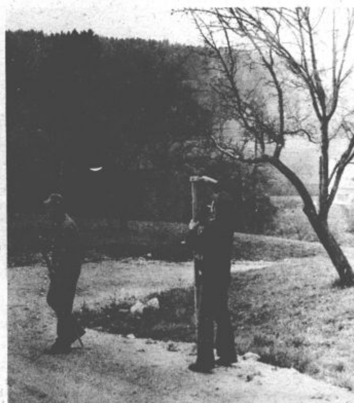
Delavci Komunalnega centra si v teh dneh prizadevajo, da bi pripravili vse potrebno, da jih prvi sneg ne bi presenetil. Tako so v teh dneh postavljali palice, ki bodo, ko bo zapadel sneg, označevale rob cestišča.

Posebej pa naj omenimo še krožek zbiranja izročil in ohranjanja tradicij NOB, ki je pripravil 9 pohodov, udeležili pa so se še proslave ob odkritju spomenika padlim borcem Sercejeve brigade ter srečanja slovenskih internirancev v Podlujbelju. Sodelovali pa so še v natečaju revije Pionir na temo »Solstvo v NOB« in za nalogo prejeli srebrno plaketo in priznanje.