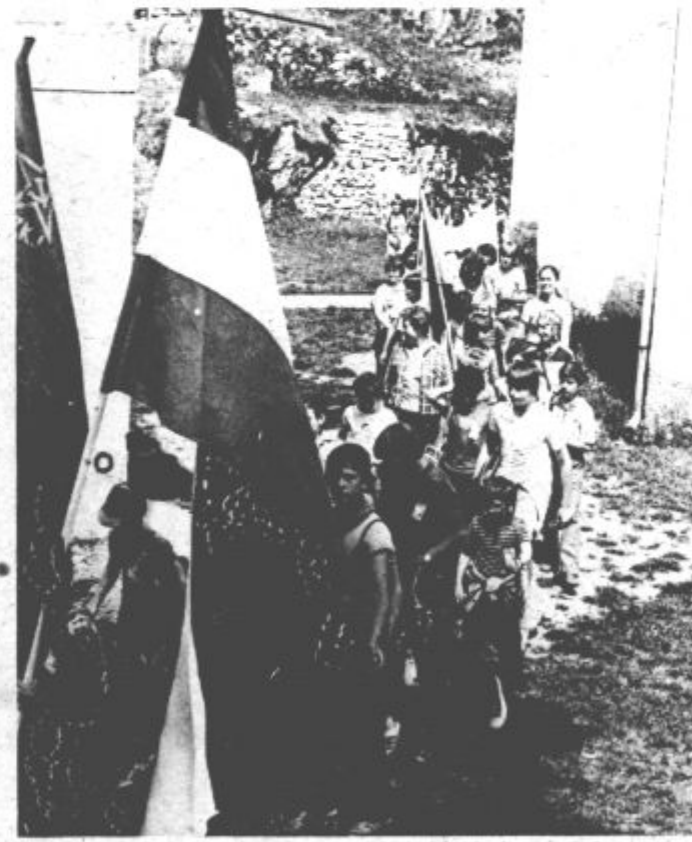
Ohranjanje tradicij NOB je pomembna naloga pionirjev