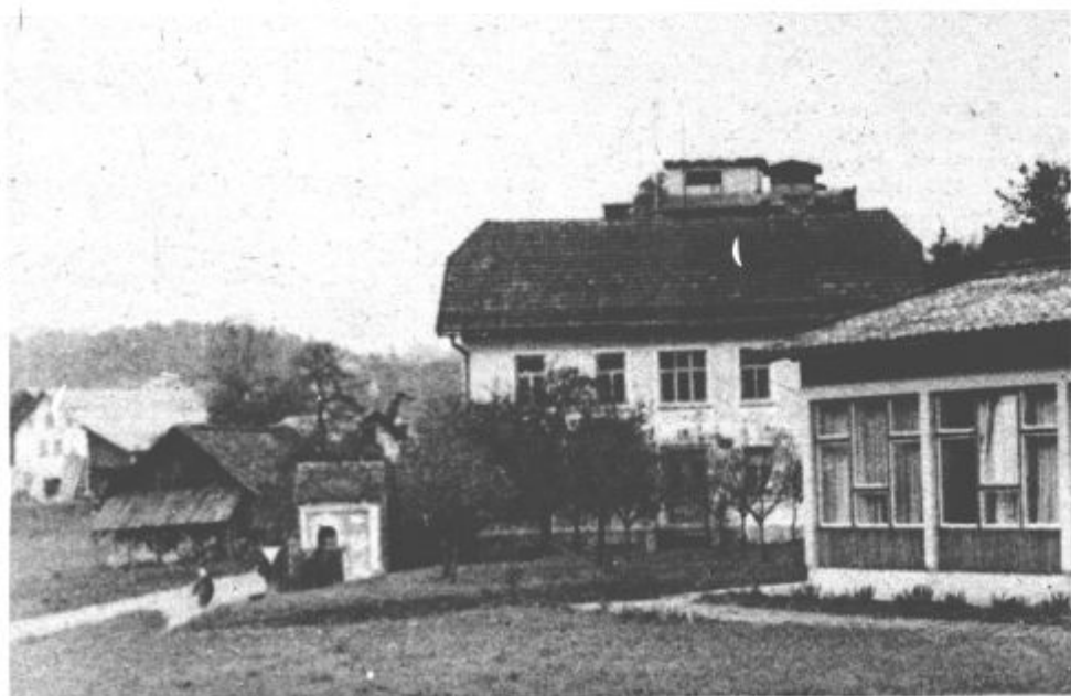
V prihodnjem letu bodo pričeli z adaptacijo doma

Pospešeno pa se pripravljajo načrti za melioracijo šentiljskih močvirij. Delovna organizacija Nivo sedaj izvaja meritve tako, da bi v letu 1983 že lahko pričeli uresničevati tudi to nalogo. B. Z.