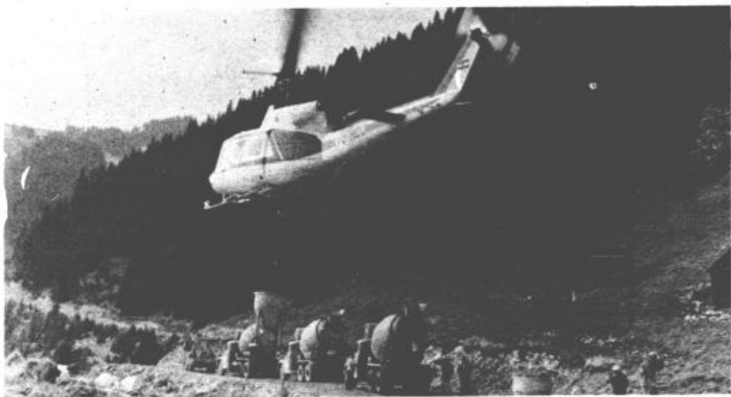
»Betniranje s helikopterjem je hitrejše pa tudi cenejše,« so nam dejali