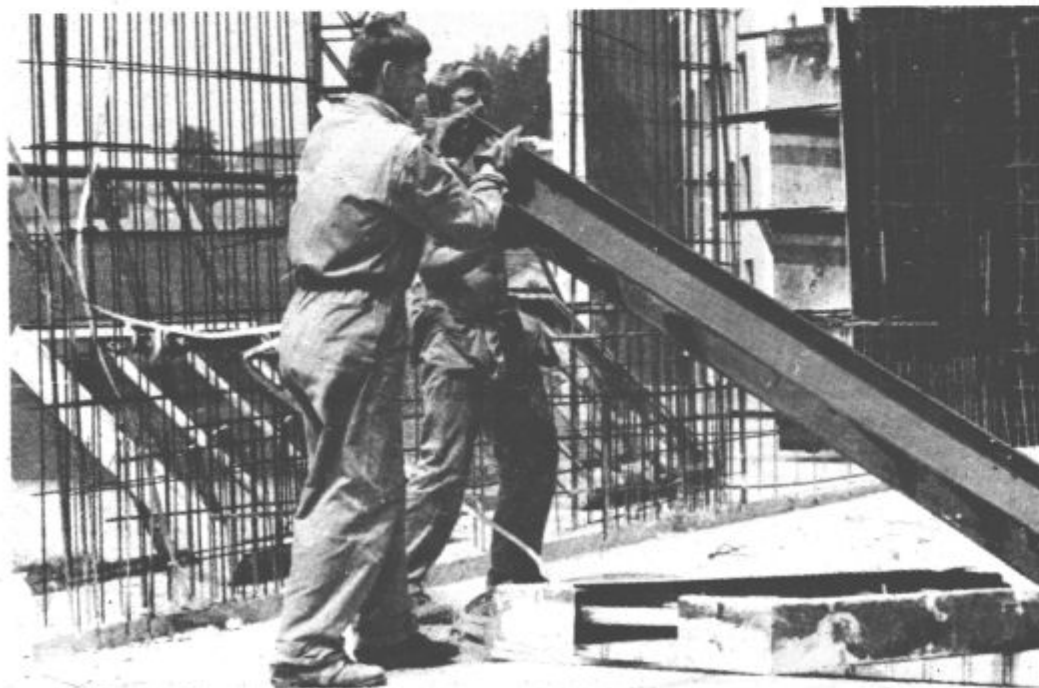
Z dobrim delom bodo tudi v prihodnje konkurenčni na tržišču