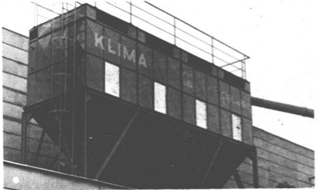
Obnovo moti pomanjkanje rezervnih delov domača podjetja

No, kljub številnim težavam, ugotavljajo, da imajo svoje zmogljivosti za prihodnje leto še kar zadovoljivo zasedene. Da pa bodo lahko poslovali dobro tudi v prihodnjih letih, ko se stanje kot vse kaže še ne bo izboljšalo, bodo morali posvetiti vso pozornost približanju cen tržnim možnostim, kar seveda pomeni zniževanje sedanjih cen. Se več pozornosti pa bodo morali posvetiti doseganju pogodbenih rokov boljšemu delu. Še bolj pa se bodo morali vključevati tudi v izvajanje investicijskih del v tujini, kjer so beležili v zadnjem času že dokaj dobre rezultate. Mira Zakošek