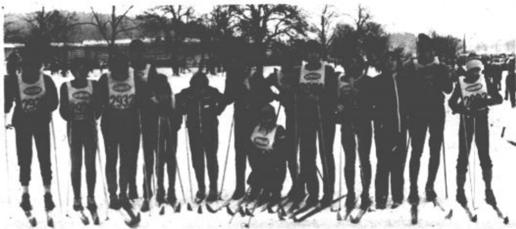
Pionirji pred startom po poteh Kokrškega odreda