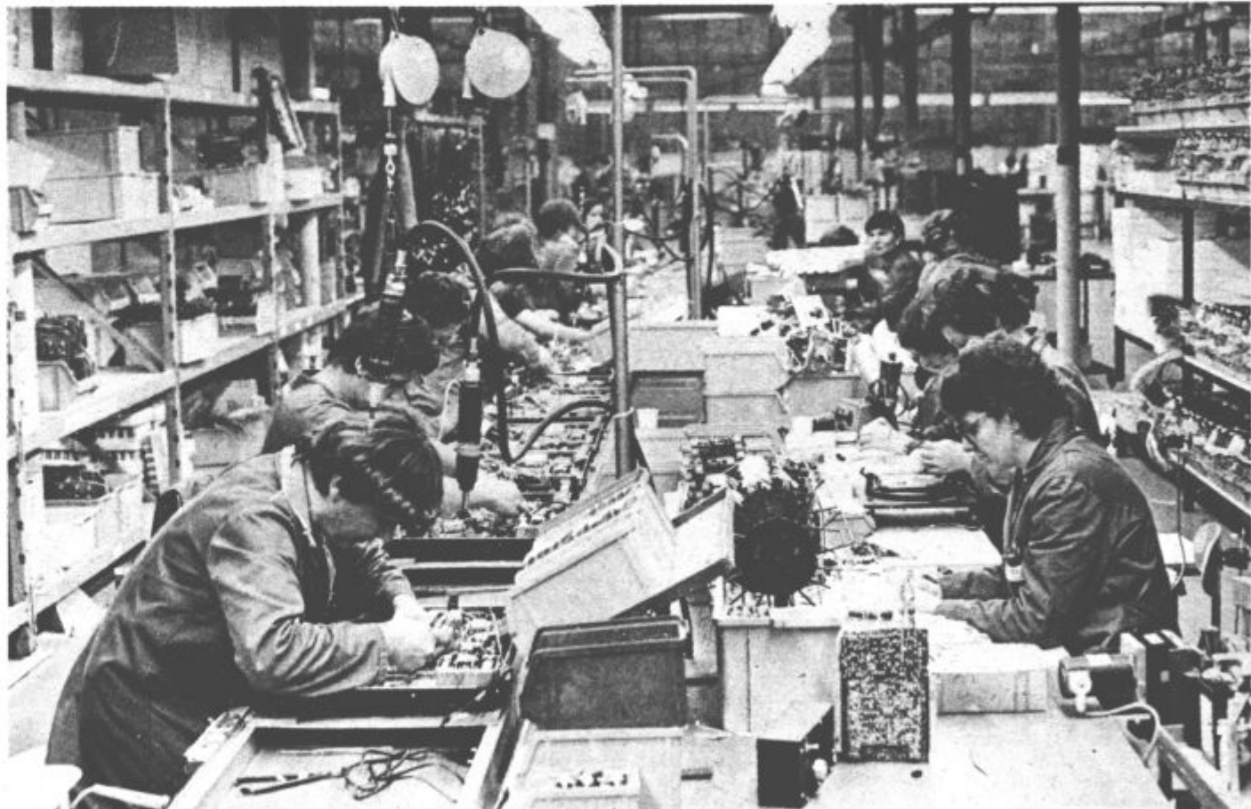
Delavci morajo odgovorno spregovoriti o gospodarskih težavah in slabostih v lastnem okolju ter storiti vse za izboljšanje rezultatov do konca leta.

Skratka, razprave morajo voditi k cilju, da bi zagotovili izboljšanje rezultatov do obrazne računa 1981.