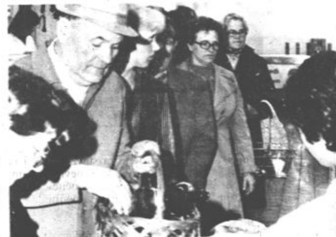
Zagotoviti kar najbolj solidno postrežbo

V tem času pa je bilo v Gornji Radgoni še več drugih zanimivih predavanj, med drugim so govorili tudi o tem, kako graditi ceneje.