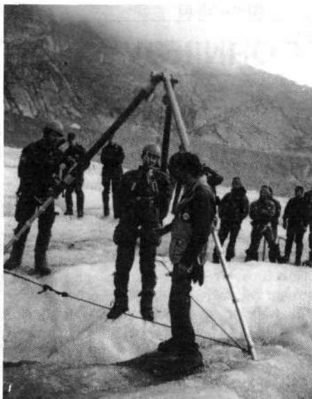
Švicarska vojska, SAC in REGA tesno sodelujejo pri gorskem reševanju v švicarskih gorah

v Švici za učinkovito pomoč in reševanje. Nehote sva se slovenska predstavnika morala spomniti nekaterih pregrehtih glav pri nas doma, ki bi svoje »vrtnice« radi skrbno čuvali zase, pa