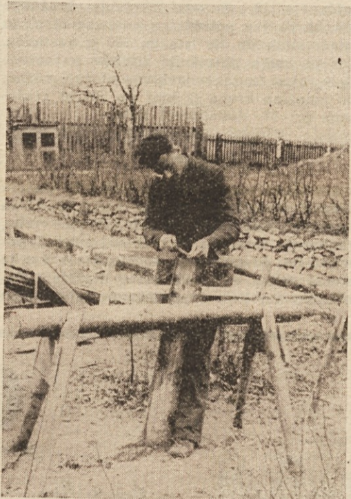
Tudi žaga je pri delu potrebna

Dokler niso nacisti prevzeli oblast, je uživalo avstrijsko šolstvo svetoven sloves. Sedaj ko se po končani nesrečni vojni že opaža novo življenje, si strokovnjaki prizadevajo, da bi privedli avstrijske šole zopet na staro stopnjo.