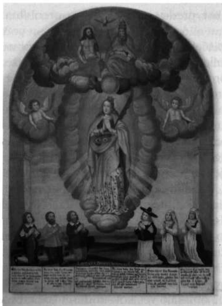
Votivna slika sv. Lucije iz stare dražgoške cerkve. Loški muzej.

Besel se je ob svojem prvem prihodu v Dražgoše čudil bogastvu cerkve v tako odmaknjem kraju. Cerkev so Nemci požgali 13. januarja 1942. Zgorelo je vse pohištvo, kot so klopi, omare, skrinje in podobno, bandera, nebo, mašna oblačila in drugi paramenti. V požaru je bilo dosti cerkvene opreme uničene ali poškodovane. Predvsem okoli prižnice, ker je bil vhod v zakristijo in naprej v zvonik, kjer je najbolj gorelo. Iz vlomljenih tabernakljev so zginili trije kelih, dve monštranci, dva ciborija in pet paten. 56