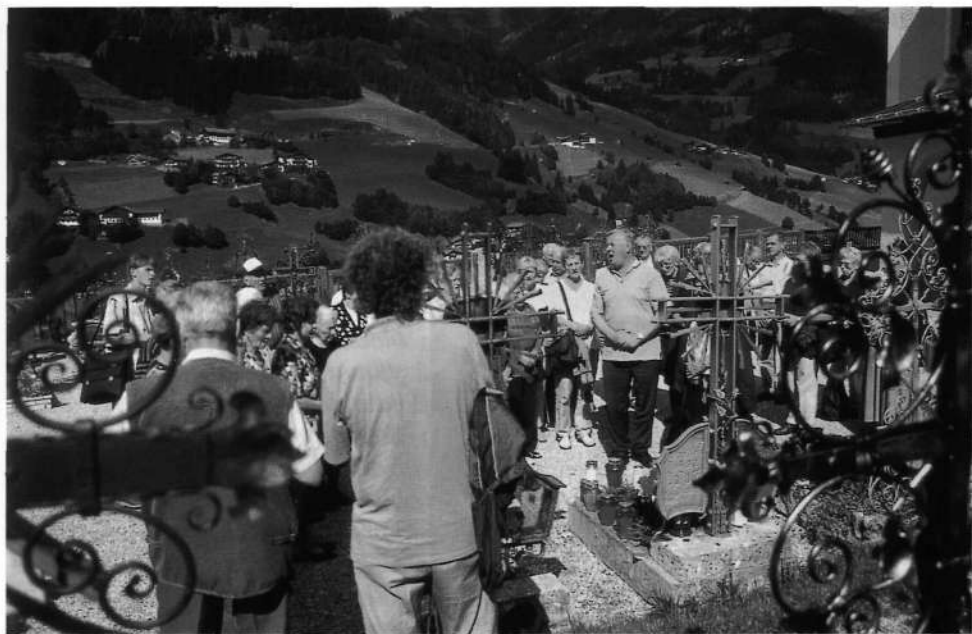
Staroločani pred Beslovim grobom 24. avgusta 2002.