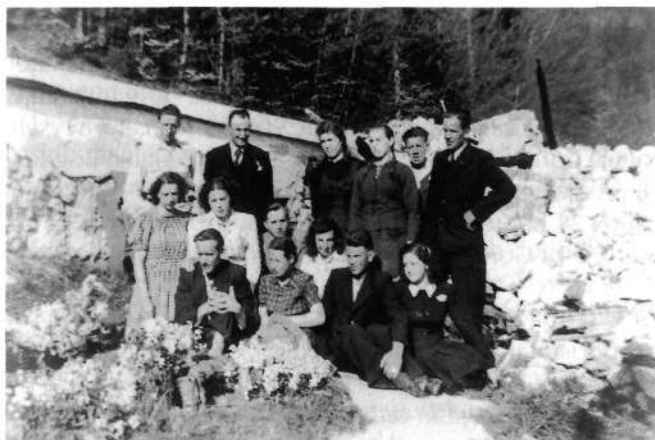
Fantje in dekleta z Jamnika in iz Dražgoš ob skupnem grobu na starem dražgoškem pokopališču za veliko noč 1943. Desno od skupine so razvaline porušene cerkve.

pacijske minerske skupine v Dražgošah sistematično porušile vse hiše, hleve, šolo, prosvetni dom, sokolski dom, kapelice, župnišče, mrtvašnico, cerkev – skupaj 245 zgradb.