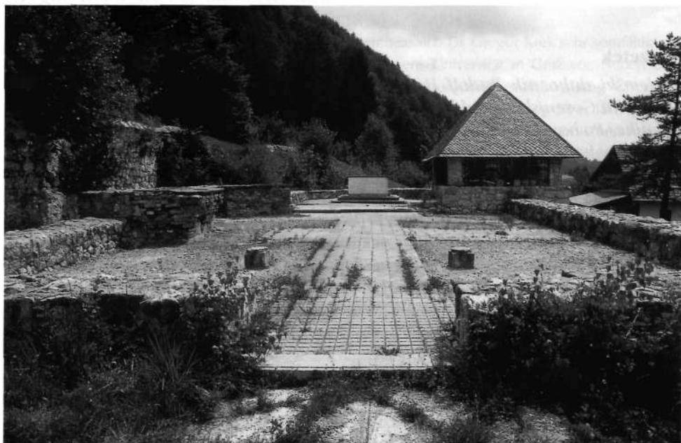
Ruševine stare cerkve so vaščani nekaj malega uporabili za gradnjo, predvsem za zid novega pokopališča. Leta 1992 so farani odpeljali preostale ruševine, prezentirali talne ostanke cerkve in uredili pokrit lapidarij v temeljih nekdanjega zvonika.