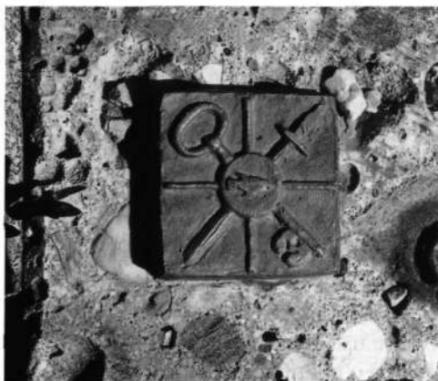
Grb na Beslovem grobu v Grossarlju.

Pri prijavi vojne škode, ki jo je NOO Dražgoše vložil 8. 9. 1945, so med drugo škodo, ugotovljeno pri cerkvi sv. Lucije, navedeni tudi baročni oltarji vsi pozlačeni (lepi, polni svetnikov in okraskov) ,