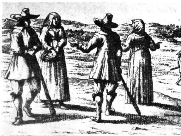
Gorenjska noša iz doma tkanege platna kot jo je pokazal Valvasor v Slavi vojvodine Kranjske 1689