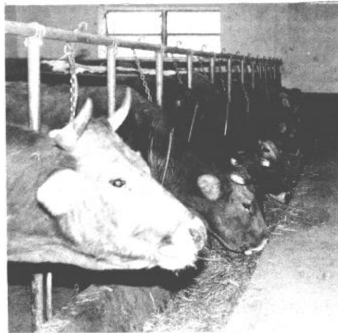
Na starem pogorišču so zgradili moderen hlev.