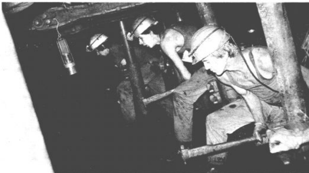
Na rudniku lignita Velenje je lani zaradi bolniške izostalo z dela vsak dan 476 delavcev, s čimer so izgubili približno 700 tisoč ton premoga. O tem ter o drugih vprašanih so spregovorili podrobno na nedeljski seji konference osnovnih organizacij sindikata te delovne organizacije.

Ko že pišemo o ustanavljanju družbenih svetov v občini Velenje naj samo še omenimo, da je komite občinske konference ZKS na seji 13. februarja 1980 sprejel stališče, da je vzrok za to, da še niso ustanovljeni in da še ne delujejo družbeni sveti tudi v tem, da se posamezniki ne zavedajo vloge in pomena, ki jo imajo družbeni sveti. Torej so tudi subjektivni vzroki krivi, da v Saleški dolini vse doslej še ni zažvelo delo družbenih svetov. M. Linovšek