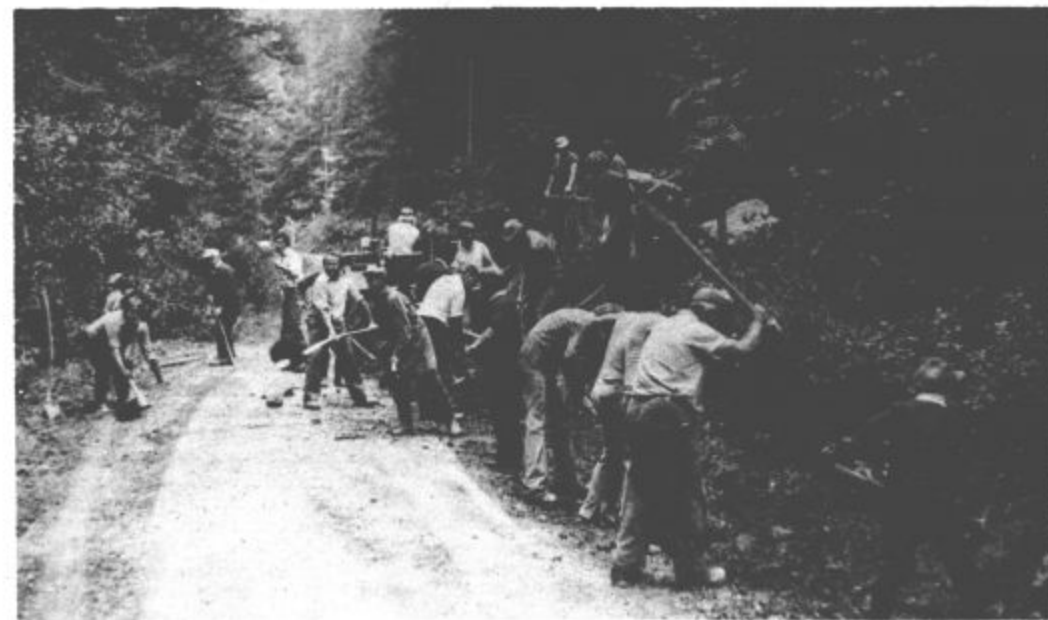
Pri urejanju cest opravijo veliko dela krajani sami. Tako se so lotili ceste v Veliki vrh.