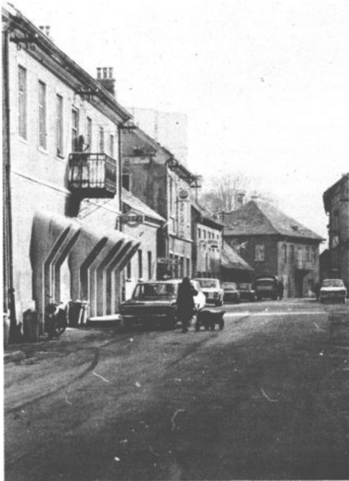
Staro Velenje je potrebno adaptirati

spevka, niso majhni in večini je s temi sredstvi uspelo odpraviti najbolj pereče probleme. Prav tako lahko s gotovostjo trdimo, da v vseh krajevnih skupnostih v občini Velenje v tem času, ko se izte-