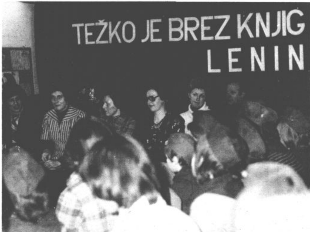
Ob podelitvi Kajuahovih bralnih značk učenci povabijo v svojo sredino slovenske pisatelje ter radi prisluhnejo njihovim zgodbam.