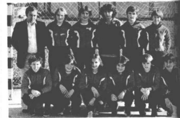
Rokometašice Šmartnega ob zaključku prvega dela prvenstva