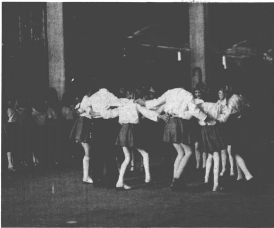
Kulturno društvo Oskar Hudales tesno sodeluje s prosvetnim društvom na vseh proslavah in prireditvah v kraju.

Interesne oziroma prostovoljne dejavnosti vodijo učitelji na šoli. Pri delu pa se srečujejo z velikimi težavami, predvsem pri sestavi urnika, kajti šolski okoliš je zelo širok. Za delo v vseh dejavnostih pa jim primanjkuje tudi zunanjih sodelavcev.