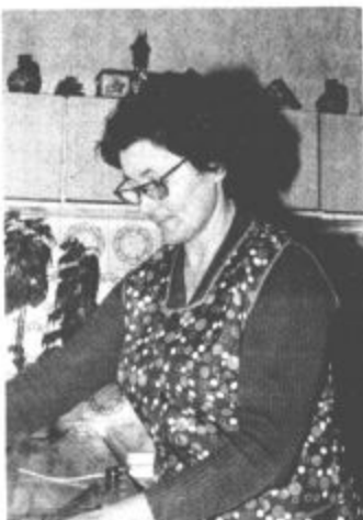
Gospodinja je danes vedno manj na polju.

Kmetovati v sedanjih časih in nekdanj je velika razlika. Na kmetiji sem začel gospodariti z „enim repom“ hlevu. Časi so se spreminjali. Razmere za kmetovanje tudi. Pred leti smo kmetijo preusmerili v živinorejsko proizvodnjo. S kreditom smo nabavili stroje za obdelovanje hribovskih površin in preuredili hlev, v katerem imam 23 glav. Sedaj je samo 17 repov, ker vsako leto prodamo na zimo 8 do 9 pitancev.“ Ko smo ga vprašali, s čim se poleg živinoreje še ukvarja, je dejal, da ima nekaj površin posejanih s peso, koruzo in krompirjem, ki zahtevajo še ročno obdelovanje. V tem času je vstopila v kuhinjo še gospodinja in se takole vključila v pogovor: „Kmetovanje se je v današnjem času res spremenilo. Vloga gospodinj pa je še vedno ostala enaka. Toda delo je kljub temu lažje, saj imamo kuhinjske pripomočke. Moje roke so na njivi še vedno