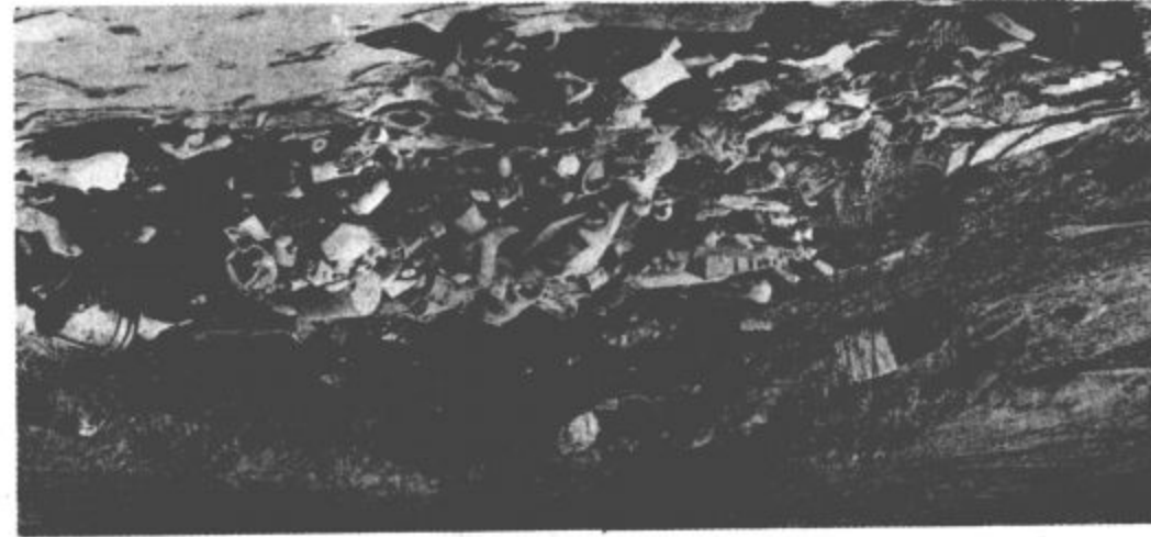
Z zbora občanov Škal in Hrastovca

Poleg kopice majhnih težav, ki jih mladi rešujejo sproti, pa jih pestijo še številne druge, kot so razkropljenost mladincev in izmensko delo. Pa kljub temu lahko trdijo, da so z boljšo organiziranostjo dosegli določen napredek. Tudi v prihodnje se bodo trudili, da bi dosegli še boljše delovne uspehe, saj je pripravljeno mladih za delo velika. Aktiven mladinec je po njihovem mnenju dober samoupravljalec in glavni nosilec nalog sindikata.