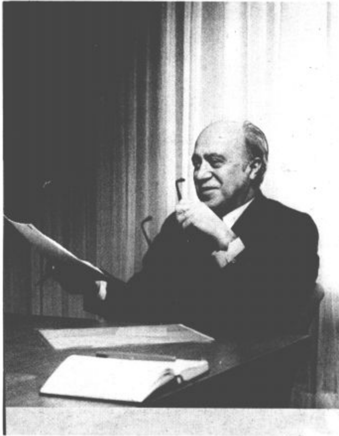
Mitja Ribičič, predsednik republiške konference socialistične zveze delovnega ljudstva Slovenije: »Moč, pomen in vloga socialistične zveze delovnega ljudstva se kažejo tudi v razmišljanju in pripravljenosti ljudskih množic, ko v tem trenutku poslabšane mednarodne situacije izpričujejo neverjetno pripravljenost braniti Titovo Jugoslavijo, ko vsak posameznik čuti to našo politično usmeritev, naše smeri razvoja kot svojo stvar!«

Ljudi ne smemo deliti na vernike in ateiste, temveč na poštene državljane, rodoljube, samoupravjalce, ki jih je ogromna večina, pa na tiste, ki so lenuhi, paraziti in ki se izločajo iz naše družbe.