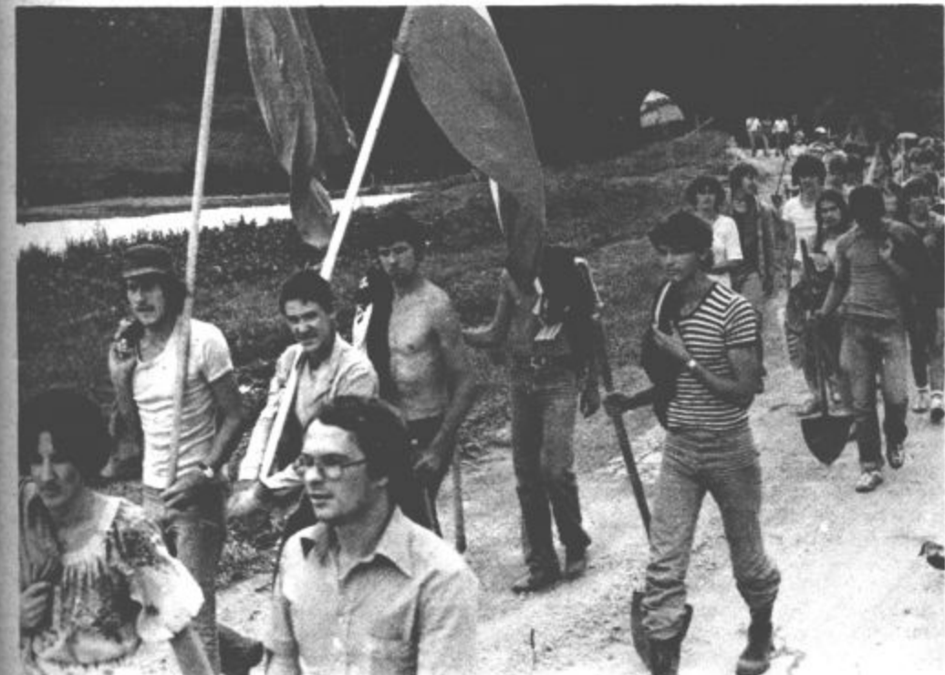
Gimnazijci se udeležujejo tudi delovnih akcij.