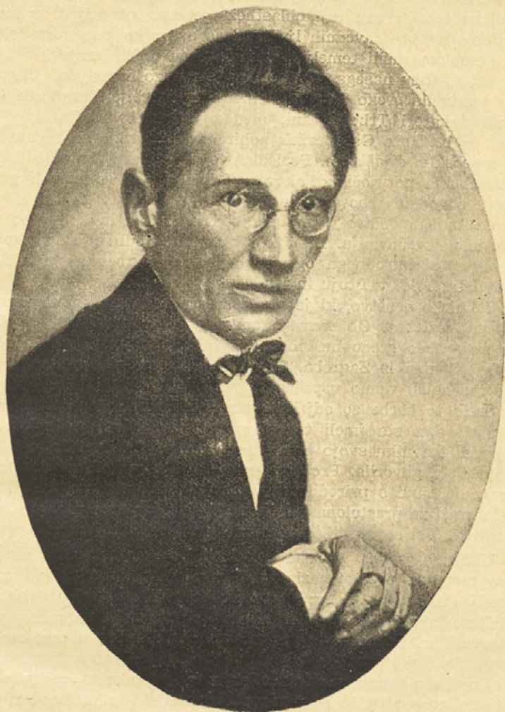
PESNIKU OTONU ŽUPANCICU

LETO VIII. • CELJE 20. FEBRUARJA 1938 • ŠTEV. 2