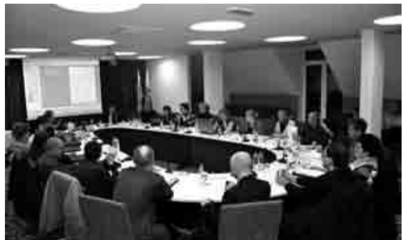
Podjetje Acer pripravljajo bodoči prostorski načrt naše občine