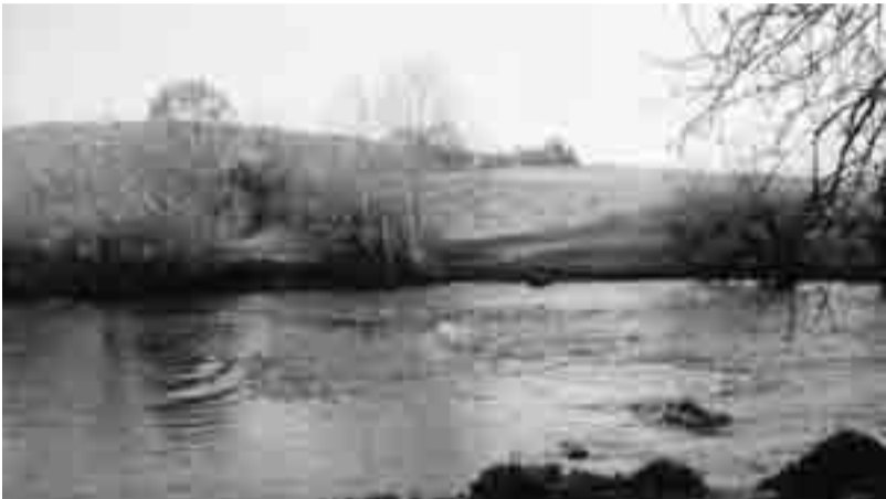
Današnji pogled na nekdanji Španov brod, kjer so popotniki prečkali reko Krko