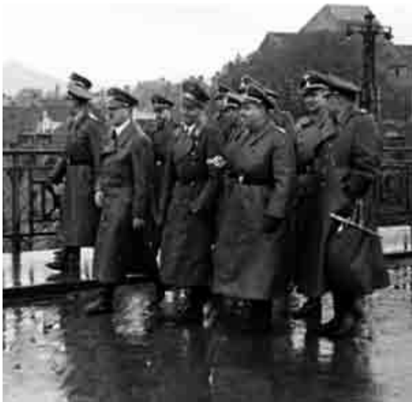
Hitler s sodelavci v aprilu 1941 obišče Maribor