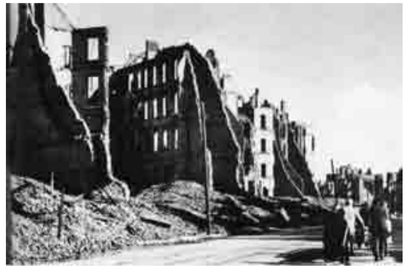
Nemčija 1. 1945

Nemški vojni stroj pa se je vrtil, vendar vse počasneje in požiral človeška življenja na vseh straneh. Grozodejstva nad civilnim prebivalstvom, ki so jih običajno izvajale nacistične bojne enote SS, so navadne civiliste, vpoklicane nemške vojake in oficirje, hudo prizadevale, saj teh ravnanj in nasilja v večini niso odobrvali. V čas po vrsti nemških vojnih porazov (El Alamein poleti 1942, Stalingrad zima 1942/43) spadajo tudi prvi poskusi ozaveščanja prebivalstva z letaki, saj je bila moč Goebelsovega propagandnega stroja tako velika, da ljudje niso vedeli, kaj se v resnici dogaja na frontah in zasedenih ozemljih, šele možje, bratje in sinovi, ki so prihajali na dopust, so jim povedali resnico. Konec 1. 1942 je gestapo v Munchnu med študenti odkril odporniško skupino Weisse Rose (Bela vrtnica). Vsi so bili aretirani, obsojeni pred 'ljudskim sodiščem' in usmrčeni. Odpor proti nečloveškemu nacističnemu režimu, pa naj je šlo le za sočutno pomoč prisilnemu delavcu ali judovskemu otroku, je bil