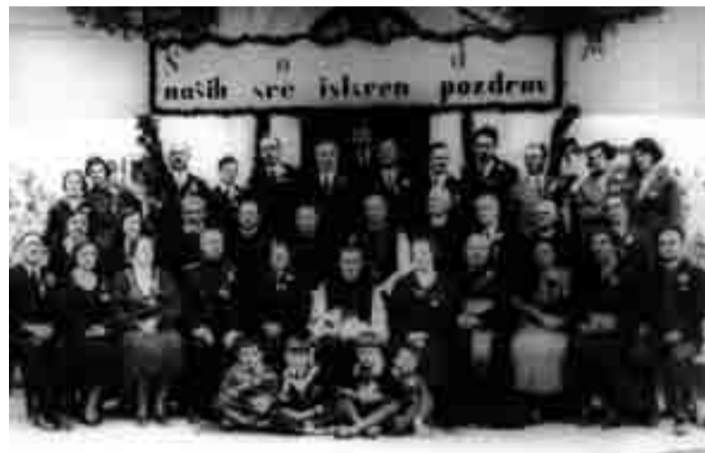
Novomašnik s sorodniki in gosti po novi maši v Stični