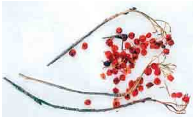
Rodne vejice in plodovi mokojnice

mer makujunca ali mrkunca. Nazadnje so plodove te divje rastline uživali med drugo svetovno vojno in po njej. Kruh menda ni bil posebno dober. O njem pa je znan izrek, ki so ga radi pravili moški: »Mokojničen kruh speci, pa k babi v posteljo teci.« Če je res kaj pomagalo, ne vemo: starejših moških ni več, ženske pa o tem nočejo nič slišati. Po številnem potomstvu v tistih časih bi rekel, da je morda res kaj na tem.