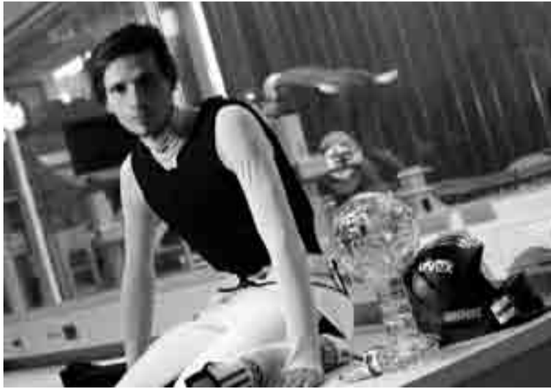
Do globusa za polete z Akrapovičem