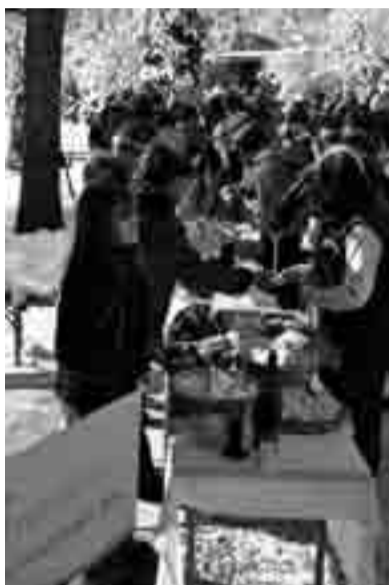
Brez članic podeželskih žena Ivanjščice seveda ne gre