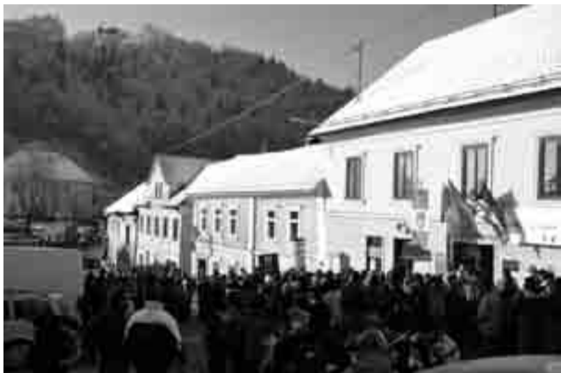
Letos je na štartu Planinsko društvo Polž prvič pobiralo tudi prostovoljne prispevke

Prvo soboto v marcu smo v naši občini že tradicionalno sprejeli v goste tisoče pohodnikov in ljubiteljev naše narave in bogate kulturne dediščine, ki so jo že 17. po vrsti doživljali ob pohodu po Jurčičevi poti. Letos naj bi bilo pohodnikov vsaj 10.000, in brez dvoma se je dalo začutiti glavno sporočilo prireditve; ljudje prihajajo na Jurčičevo pot, ker je to za številne planince in druge ljubitelje hoje v naravi otvoritev vsakoletne pohodniške sezone, za vse ljubitelje kulture pa hrana za dušo in srce.