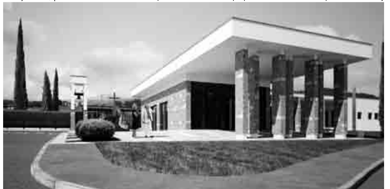
Objekt skupaj z arkadami obsega skoraj 400 m 2

Za odbor za izgradnjo mrliške vežice v Šentvidu pri Stični Tomaž Šraj