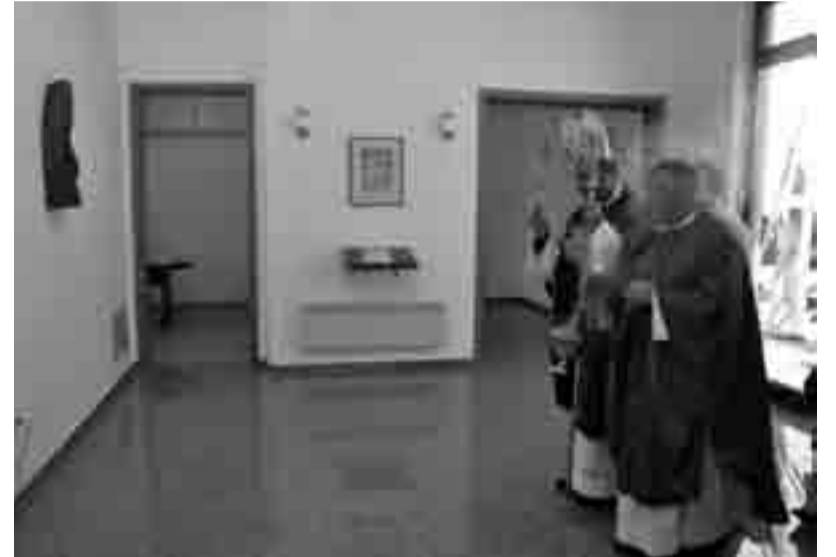
V novem poslovilnem objektu najprej vstopimo v večjo avlo, na levi in desni sta mrliški vežici s pripadajočima kuhinjama za svoje. V kletnih prostorih se nahajajo sanitarni prostori in prostori za shranjevanje pokopališke opreme.