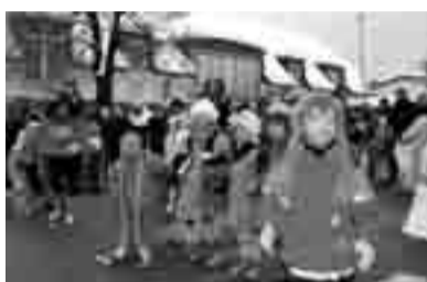
Najmlajši iz plesne šole Guapa so najbolj uživali