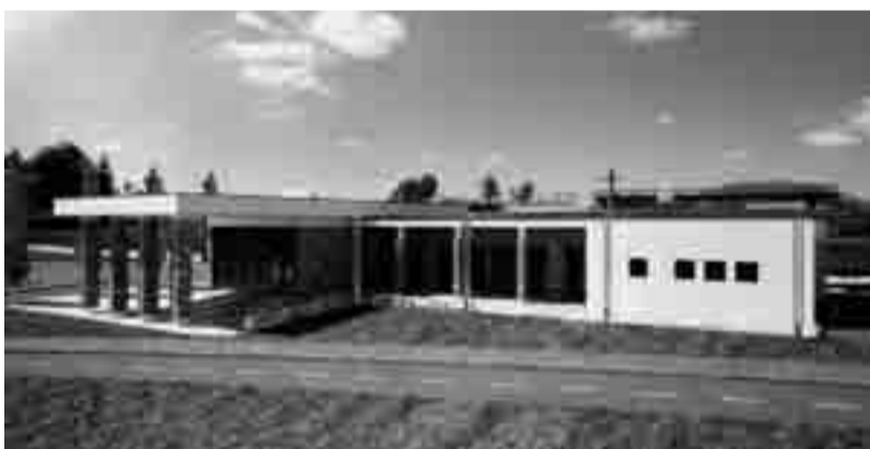
Pogled na novo mrliško vežico s ceste proti Petrušnji vasi (3D projeckija)

Glede na najustreznejšo lokacijo (del parkirišča pri novem pokopališču) je bilo potrebno spremeniti namembnost zemljišča, to pomeni, da je bilo potrebno spremeniti in dopolniti odlok o sprejetju ureditvenega načrta pokopališča v Šentvidu pri Stični. V zvezi z aktivnostjo pri pridobitvi zgoraj omenjene spremembe so bile vključene tudi arheološke raziskave, ki pa niso potrdile nobenih