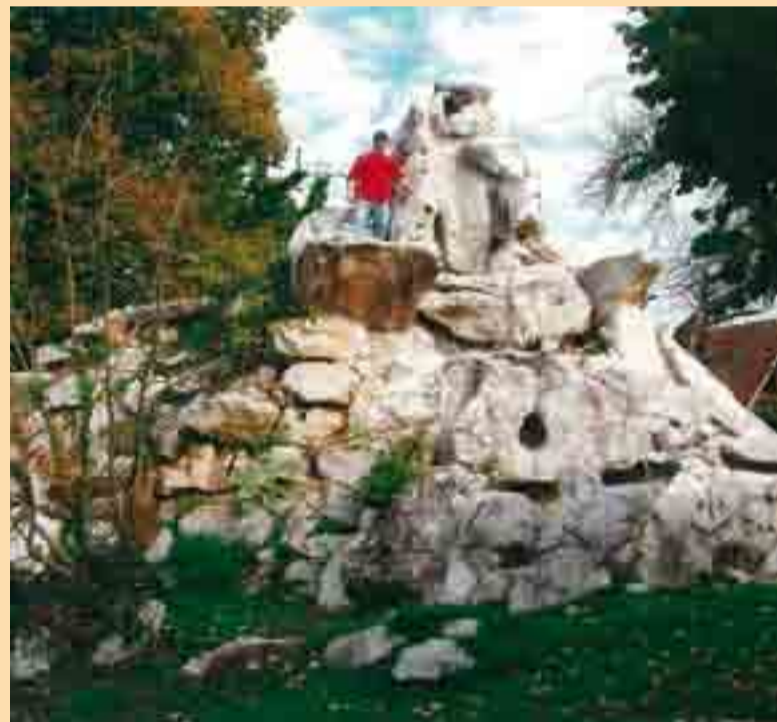
Pod luknjo v skali je globlja kotanja, napolnjena z vodo. Tam so med 1. svetovno vojno zakopali bronast zvon in ga na ta način rešili pred prelitjem v topove.