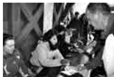
Še zadnji žig

Tudi ob letošnjem pohodu lahko ugotovljamo, da je Jurčičeva pot dobro sprejeta tako med domačini kot številnimi Slovenci in bo še kako dobrodošla, da društva in druge organizacije skupaj z občino strnejo svoje moči tudi v bodoče. Zagotovo bi moral biti cilj tako mno-