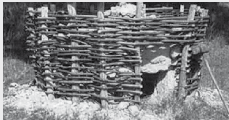
Preprosto so apnenice gradili iz protja in gline

Od domačih opravil je bilo pri nas na kmetih včasih razširjeno tudi žganje apna. Za to sta bila najbrž dva razloga. Prvič, apno je bilo neobhodno potrebno v sodobnem zidarstvu za apneno malto, in drugič, žganje apna je bil razmeroma dober zaslužek kot postranska dejavnost na kmetih. Pri žganju apna ni bilo večjih stroškov, kamen apnenec je bil na kraških tleh zastonj, les za kurjavo apnenice pa tudi. Potrebno je bilo le nekoliko znanja in delo, ki pa je bilo dostikrat bolje poplačano kot pridelki v kmetijstvu.