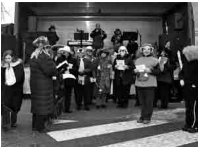
Harmonija je zapela našemljena

Ples, pesmi in pustni sprevod je spremljal tudi zanimiv program. V likovni delavnici so obiskovalci pod